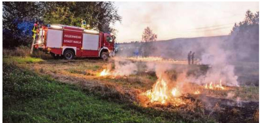
Bekämpfung eines Brandes beim Kinderheim Martinsberg, der im September 2016 auf einem Stoppelfeld in der Nähe ausgebrochen war.

2019 In diesem Jahr wird uns der neue Rüstwagen übergeben.