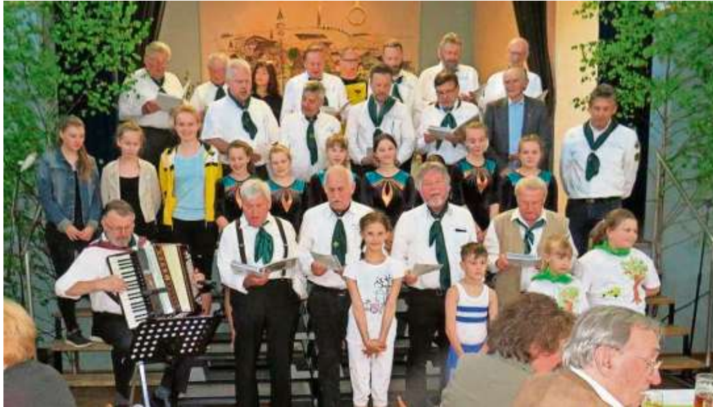
Das zehnjährige Bestehen der Gesangsgruppe AdelbergBoum feierte man mit einem „CaesarianenDouch“ in der TSV Turnhalle, garniert mit turnerischen und tänzerischen Darbietungen sowie einem gemeinsamen Wertshaussingen.