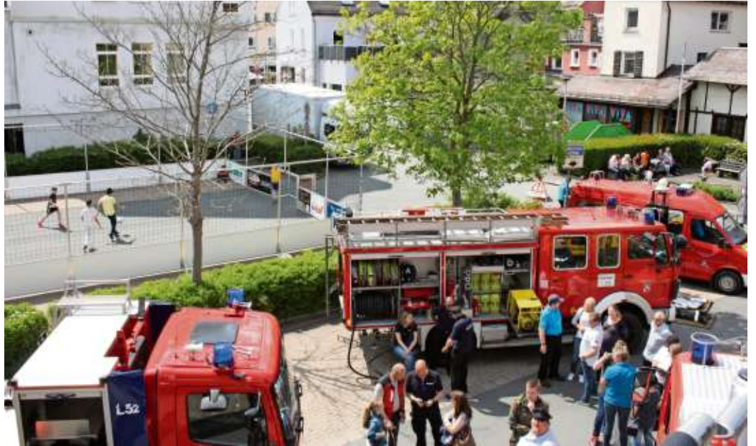
Die Freiwillige Feuerwehr war auch beim Nailaer Frühling mit dabei.

Mit einem großen Programm feiert die Freiwillige Feuerwehr Naila ihr 150-jähriges Jubiläum.