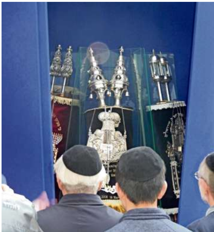
Auf dem Foto sind einige Männer der Marxgrüner Reisegesellschaft mit Kippas vor dem Schrein mit den Thora-Rollen in der jüdischen Synagoge in Chemnitz zu sehen.