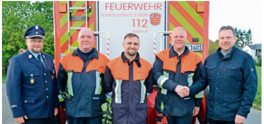
Üben für den Ernstfall: Zwei Gruppen der Feuerwehr legten die Leistungsprüfung THL erfolgreich ab.