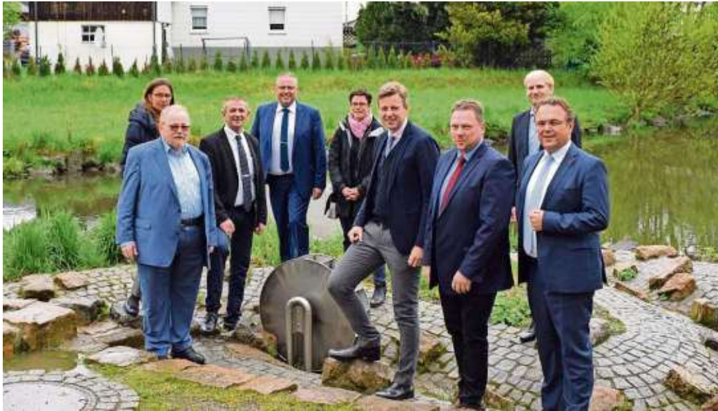
Besichtigung des Wasserspielplatzes am Anger in Selbitz mit den Bürgermeistern aus SSN+ und den Ehrengästen.

Selbitz - Der Tag der Städtebauförderung findet jährlich in der ganzen Bundesrepublik statt. Ziel ist es, die Erfolge der Stadtentwicklung sichtbar zu machen und zu feiern. Dieses Jahr wurde in Selbitz - nach erfolgreicher Umgestaltung - der Anger als neuer Lebensmittelpunkt von Selbitz eröffnet. Am Samstag, den 11. Mai, fand eine Einweihungsfeier im angrenzenden Veranstaltungsraum in der Kulmbacher Straße 2 statt. Auch dieses Gebäude wurde im Zuge der Aufwertungsarbeiten saniert und im Erdgeschoss öffentliche Toiletten sowie ein Raum für Veranstaltungen geschaffen. Am Tag der Städtebauförderung war dieser mit über 60 Bürgerinnen und Bürgern sowie geladenen Ehrengästen gut gefüllt. Neben einer Ausstellung zur Stadtentwicklung in der Zukunftsallianz SSN+ war der Gemeinschaftsraum an diesem regnerischen Tag idealer Raum für die Reden, Glückwünsche und den Segen für die offizielle Eröffnung des