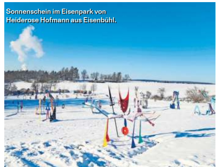
Sonnenschein im Eisenpark von Heiderose Hofmann aus Eisenbühl.