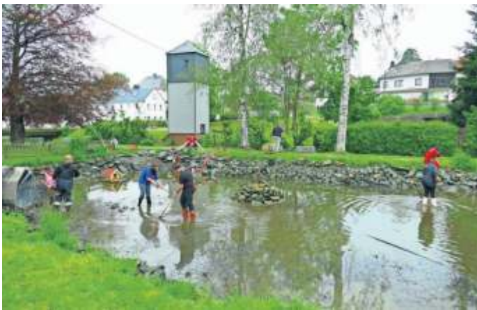
Vor dem Ablassen des Löschteichs wurden die Fische mit Keschern eingesammelt.

Wahlperiode war von Reitzenstein auch stellvertretendes Mitglied in der Gemeinschaftsversammlung.