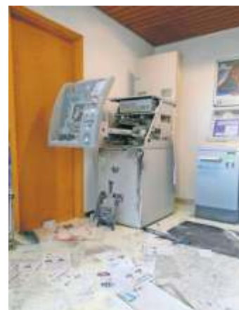
Kein Bargeld konnten die Täter erbeuten, die den Geldautomaten der Sparkasse Hochfranken und der VR-Bank Fichtelgebirge-Frankenwald im Issigauer Rathaus sprengten.