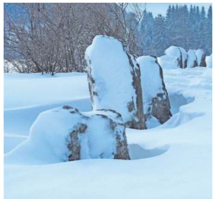
... präsentieren sich derzeit die 12 Apostel in Langenbach, fotografiert von WIR-Leser Eric Simon