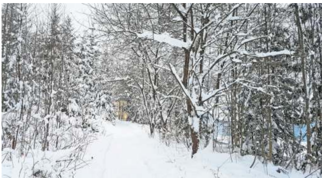
Die mit Schnee bedeckte Ruhebänk oberhalb von Silberstein mit Blick auf den Ort (Foto oben). Das zweite Foto zeigt einen Teil des Ortsteils Silberstein mit dem Waldgebiet „Hahnenkamm“ dahinter. Das dritte Bild zeigt den verschneiten Weg in der Nähe des TSV Sportheims, der trotzdem für einen Spaziergang genutzt werden kann.