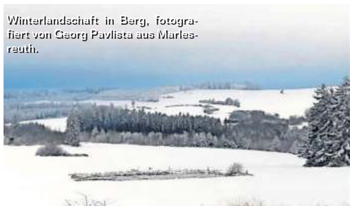
Winterlandschaft in Berg, fotografiert von Georg Pavlista aus Marlesreuth.