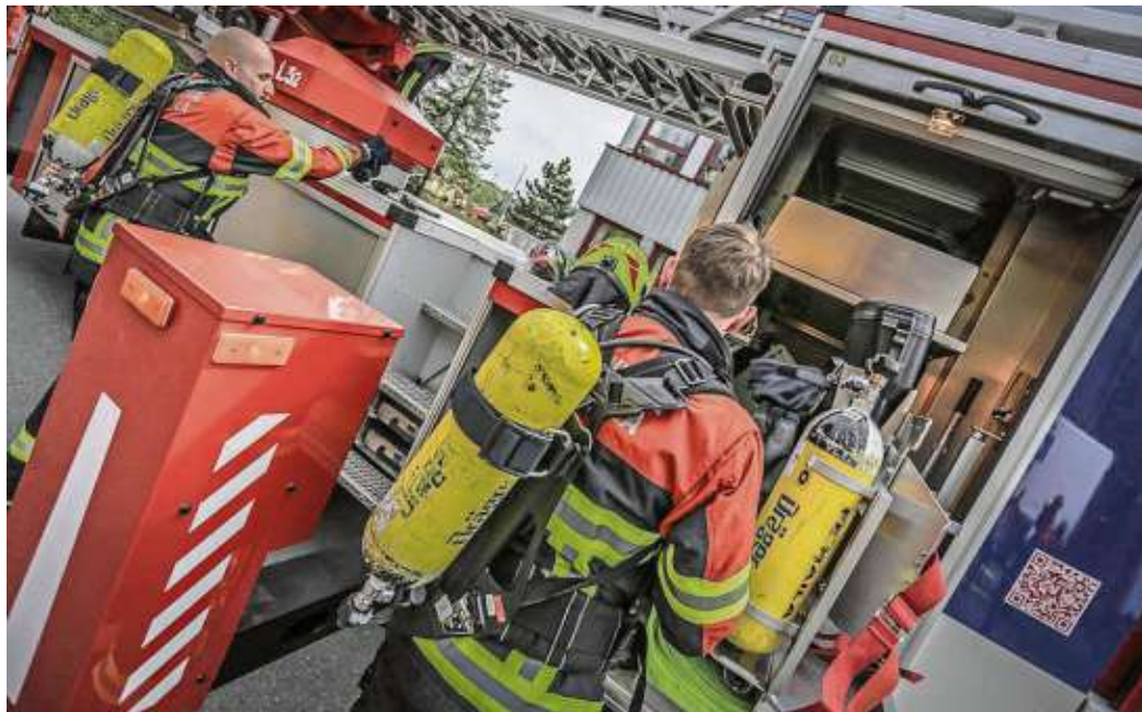
Jedes Jahr präsentieren sich die Brandschützer beim Frühlingsfest mit einer großen Einsatzübung - hier beim Frühlingsfest 2018.

Um 13.45 Uhr treffen 30 Oldtimer-Feuerwehrfahrzeuge und auch ganz neue Feuerwehrfahrzeuge zu einer großen Ausstellung ein, die ab 14.00 Uhr beginnt. Zuvor ist aber ein Fahrzeugkonvoi geplant, der ausgehend vom Zentralparkplatz über Marktplatz, Weststraße, Birkgitweg, Flurstraße, Martin-Luther-Straße, Schillerstraße in die Badstraße führt. Bei der Ausstellung kann sich jeder Besucher ein Bild von der Technik von damals und heute machen. Selbst eine eigens beschaffte Dampfmaschine der Feuerwehr Hof und der alte Münchner Berufsfeuerwehr-Löschzug sind dabei. Die Kinder erwarten ein buntes Programm.