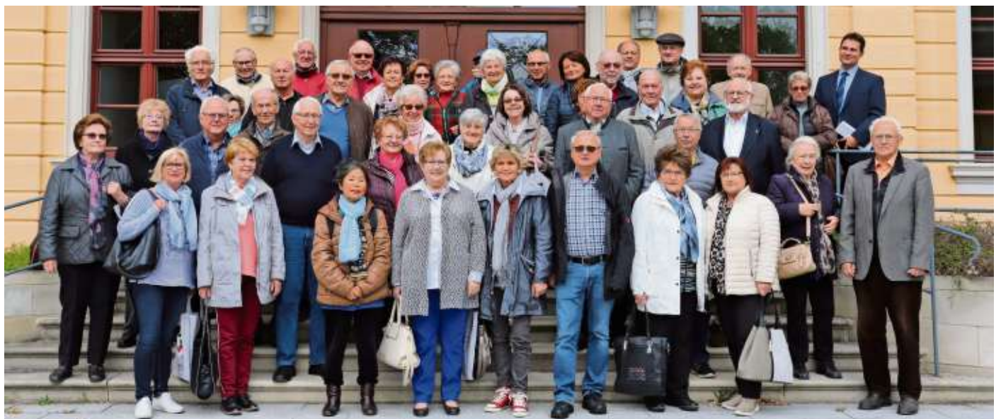
Die Teilnehmer der Fahrt vor dem Gebäude der Bezirksverwaltung in Bayreuth.

Im Anschluss wurde die Bezirksverwaltung in Bayreuth besucht. Zum Tagesablauf gehörte auch die Besichtigung der Landwirtschaftlichen Lehranstalten in Bayreuth. Bevor es ein ge-