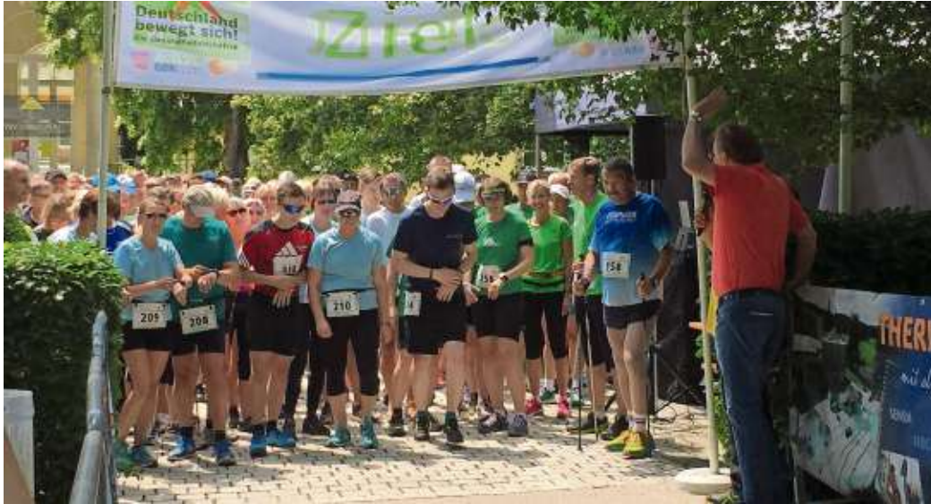
Start und Ziel des Walking Tags ist wie immer im Kurpark Bad Steben.

Bad Steben – Am kommenden Sonntag, 26. Mai, erwarten die Ausrichter vom TSV Carlsgrün und dem Bayerischen Staatsbad Bad Steben im Bad Stebener Kurpark erneut mehr als 200 Teilnehmer zum Walking-Tag. Kurzfristig entschlossene können sich auch am Sonntag noch vor dem Lauf anmelden. Für die Läufer und Nordic-Walker geht es um 13.30 Uhr wieder eine 5,3 Kilometer oder 10,9 Kilometer lange Strecke zum gemeinsamen Sport inmitten des Naturparks Frankenwald. Der TSV Carlsgrün hat dabei zwei nicht nur landschaftlich schöne, sondern auch sportlich reizvolle Touren ausgesucht. Auf der Strecke und im Ziel umsorgen die vielen ehrenamtlichen