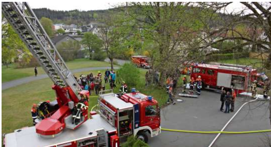
Vom 27. bis 28. April richtete die Freiwillige Feuerwehr Stadt Naila den Berufsfeuerwehrtag aus. Dabei absolvierten die Jugendlichen aus Naila, Marxgrün, Marlesreuth, Berg, Hof, Issigau, Schwarzenbach a.Wald, Selbitz, Straßdorf und die Jugendgruppe der BRK-Bereitschaft Hof eine 24-Stunden-Schicht. In diesem Rahmen fand auch eine große Schauübung statt.