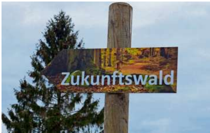
Hinweisschild am Infostand Schützenstraße