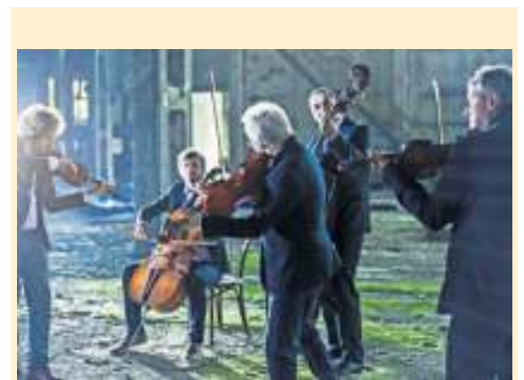
Volosi liefern eine Explosion musikalischer Energie

Einlass/Bewirtung ab 18 Uhr, Eintritt frei, um Spenden wird gebeten.