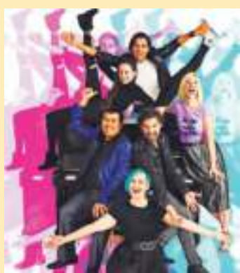
Rock, Pop, Klassik mit The Cast.

Es ist eine wilde Mischung, basierend auf alten Melodien, fetzig mit viel Spielfreude und hohem Können vorgetragen. The Cast bringen frischen Wind in die Opernwelt, inszenieren die einzelnen Partien mit Leidenschaft und gerne auch mal mit einem Augenzwinkern. Mit erfreulicher Leichtigkeit singen sie Mozart, Gounod, Lehár, die Ensemble- und Chorstücke keck wie Popsongs in den Saal schmetternd und damit gleich mit einem weiteren Vorurteil aufräumend. Einlass/Bewirtung ab 18 Uhr. Eintritt im Vorverkauf 23 Euro, an der Abendkasse 26 Euro.