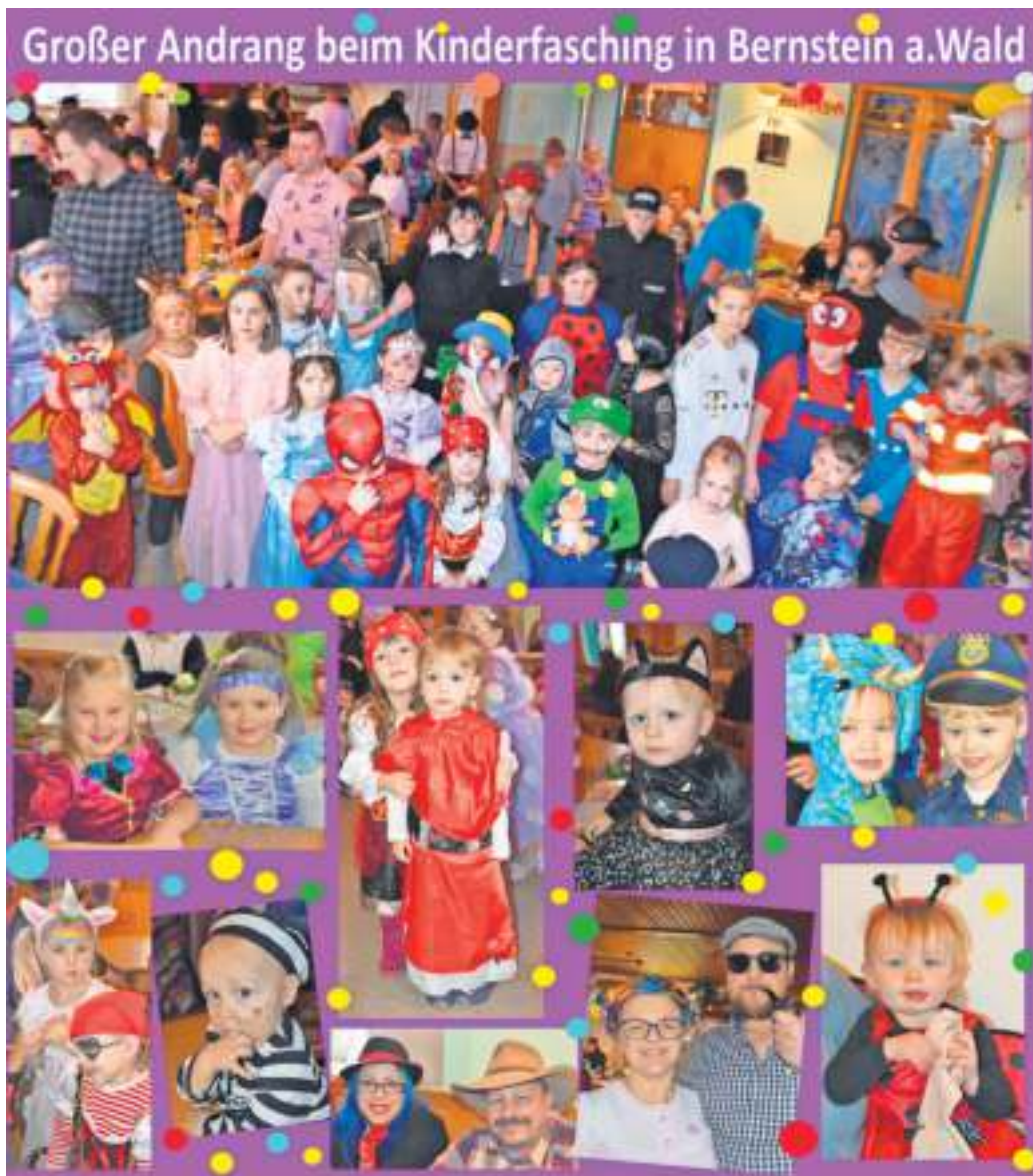
Großer Andrang beim Kinderfasching in Bernstein a.Wald

aus Meierhof ist seit 1975 beim dortigen Frankenwaldverein sehr engagiert. Das Amt des Wegewartes führt er seit 25 Jahren aus, auch mit aktiver Beteiligung bei der aufwendigen Zertifizierung des Wanderwegenetzes. Als Mann hinter den Kulissen legt er vor allem Wert auf Gemeinschaft und ist bei vielen Festveranstaltungen für Elektrik und Grillmeister zuständig. Bei Weihnachtsfeiern ist er als Nikolaus bekannt.