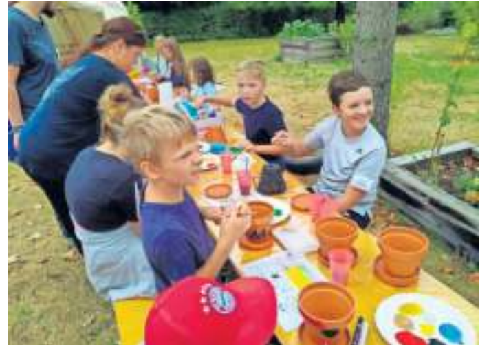
Kinderferienprogramm beim Bemalen der Blumentöpfe