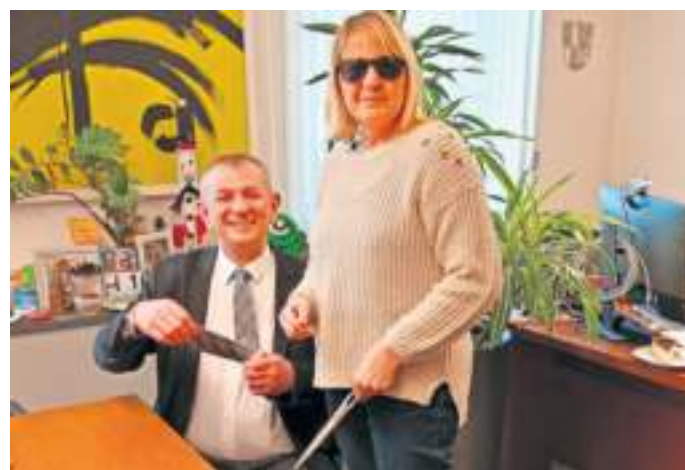
Überraschungsmoment im Amtszimmer von 1. Bürgermeister Frank Stumpf.