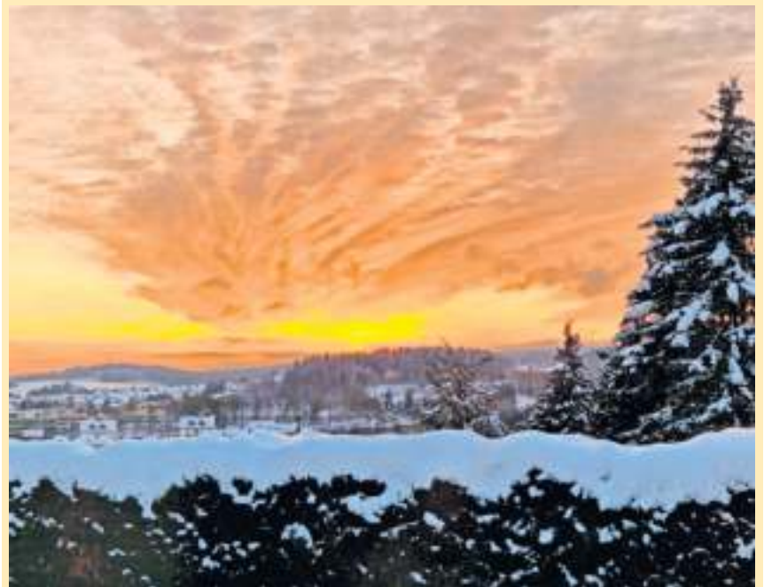
Ein gold-gelber Sonnenaufgang über dem winterlichen Naila, aufgenommen von Daniela Carius am 29. Januar.