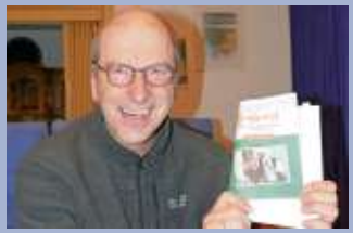
Buch von Joachim Musiolik: 100 Andachten aus Corona-Zeiten Seite 5