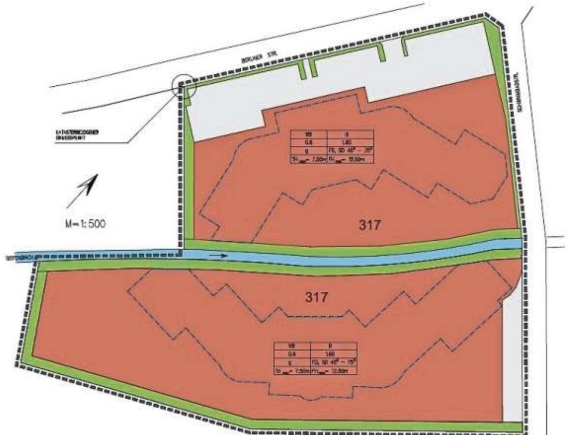
(Aus drucktechnischen Gründen ist die Darstellung nicht maßstabgetreu)

Die Öffentlichkeit wurde im Rahmen der öffentlichen Gemeinderatssitzung über die allgemeinen Ziele und Zwecke der Planung, über sich wesentlich unterscheidende Lösungen und über die voraussichtlichen Auswirkungen der Planung unterrichtet. Im Anschluss an diese Unterrichtung wird der Öffentlichkeit im Rathaus des Marktes Bad Steben während der allgemeinen Dienststunden Gelegenheit zur Äußerung und Erörterung gegeben. Ebenso werden die sonstigen Träger öffentlicher Belange und die Behörden im Rahmen der frühzeitigen Information beteiligt und angehört. Die Benachrichtigung der Behörden sowie der sonstigen Träger öffentlicher Belange erfolgt ab dem 23. Oktober 2020 (Veröffentlichung im Amtsblatt). Ferner werden die nach dem Baugesetzbuch erforderlichen Unterlagen auf der Homepage des Marktes Bad Steben eingestellt ( https://www.markt-badsteben.de/amtliches-infos/bauleitplanung-2.html ).