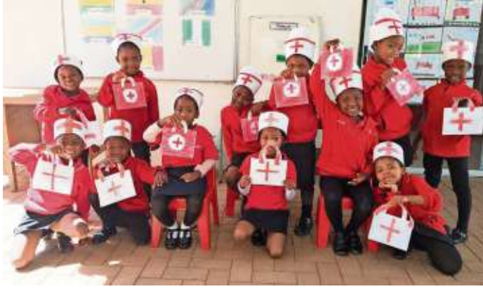
Auch Erste Hilfe bei Unfällen steht auf dem Lehrplan.

Jeppestown/Naila - Schwester Natalie Kuhn, eine am 27.6.2013 verstorbene Nonne, gründete 2004 die „Kgosi Neighbourhood“ Stiftung mit der Zielsetzung, möglichst vielen benachteiligten Kindern im Bereich von Jeppestown/Belgravia durch den Besuch einer Vorschule eine reelle Chance auf eine ordentliche Schulbildung zu geben. In Südafrika müssen die Eltern für den Besuch einer Vorschule und eines Kindergartens Beiträge bezahlen. Der Corona-Lockdown brachte für die Vorschule viele Herausforderungen: für vier Monate musste sie komplett schließen, die Kinder bekamen für vier Monate kein Wissen vermittelt und vor allem auch kein regelmäßiges, gesundes Essen. Für die Wie-