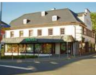
Im Ozünder-Portrait: Büro Mohr in Naila stellt sich vor Seite 13