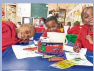
Spenden für Südafrika: Das Projekt Wings of Hope lebt weiter Seite 12