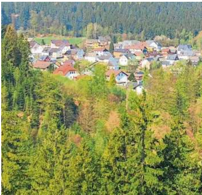
Eingebettet in den Geroldsgrüner Forst ist Silberstein. Der Ort wurde 1921 gegründet und feiert im nächsten Jahr sein 100-jähriges Bestehen.

Silberstein - Große Ereignisse werfen bekanntlich ihre Schatten voraus. Im nächsten Jahr werden es 100 Jahre, seit es den Ortsteil Silberstein der Gemeinde Geroldsgrün gibt. Im Jahre 1921 waren es Dürrenwaidbürger, die aufgrund von Baulandmangel die Siedlungsgenossenschaft Silberstein bei der Waldabteilung Silberhügel über dem Ölsnitztal gründeten. Bis zum Jahre 1972 gehörte Silberstein zur seinerzeit noch selbstständigen Gemeinde Dürrenwaid. Diese wurde im Zuge der Gebietsreform 1972 nach Geroldsgrün eingemeindet. Nun hat sich eine Interessengemeinschaft gebildet, die das 100-jährige Bestehen im nächsten Jahr mit der gesamten Silbersteiner Bürgerschaft und darüber hinaus feiern will. Initiatoren dieses Ensembles sind die Silbersteiner Marco Hornfeck, Uli Wich und Karl Deckelmann. Zusammen mit den Verantwortlichen der Dürrenwaid Frankenwaldvereins-Ortsgruppe, des Gesangvereins, der Feuerwehr, des TSV, des Burschenvereins und des Manchester United-Fanclubs fand jetzt ein erstes gemeinsames Treffen statt, um entsprechende Vorbereitungen zu treffen.