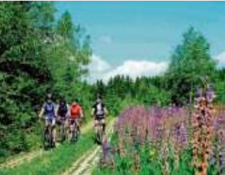
Jetzt abstimmen: Frankenwald-Radtour für den Radreise-Award nominiert Seite 7