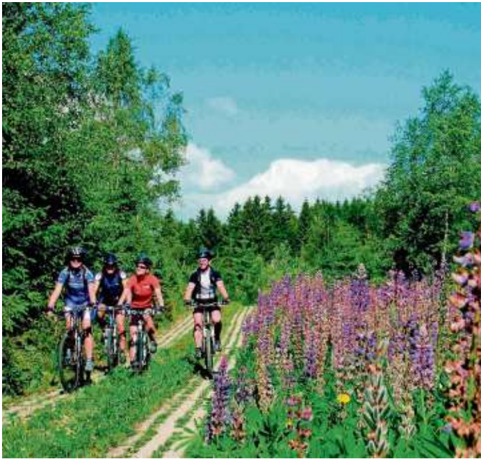
Die Radtour „Auf Zeitreise nach Little Berlin“ wurde vom Bike & Travel Magazin für den Radreise-Award nominiert.