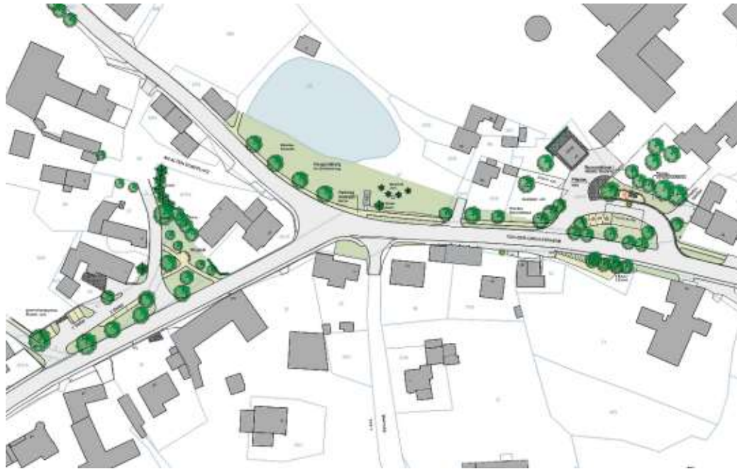
Der Plan zeigt die geplanten Maßnahmen im Gebiet der einfachen Dorferneuerung in Hadermannsgrün.

Im nächsten Jahr findet in Hadermannsgrün eine große Kanal- und Wasserleitungsbaumaßnahme statt. Von der Ina-Straße komplett durch ganz Hadermannsgrün wird ein Entlastungskanal verlegt, der das sämtliche Schmutzwasser aus Berg und den an die Kläranlage in Eisenbühl angeschlossenen Ortsteilen dorthin transportiert. Das alte Rohrleitungsnetz stammt noch aus einer Zeit, in der es in Berg noch kein Neubaugebiet und auch noch kein Gewerbegebiet gab. Mit der Vergrößerung der Gemeinde hat der alte, zu kleine Kanal und der Regenüberlauf unterhalb der INA zunehmen Probleme gemacht und hätte eigentlich schon mit Bau der neuen Kläranlage neu dimensioniert werden müssen. Durch Fördermittel des Freistaates Bayern wird jetzt die Maßnahme möglich. Damit einher geht auch das Auswechseln der alten und zum Teil maroden Wasserleitung. Gleichzeitig wird in Hadermannsgrün die Durchfahrtsstraße erneuert, die sich in einem sehr schlechten Zustand befindet. Außerdem wird die Gelegenheit genutzt und die Hadermannsgrüner Ortsmitte im Rahmen einer sogenannten einfachen Dorferneuerung ansprechender gestaltet und aufgewertet. Die Gemeinde Berg hatte die Bürgerinnen und Bürger zu einem Ortsrundgang eingeladen, bei dem Landschaftsarchitektin Susanne Augsten den aktuellen