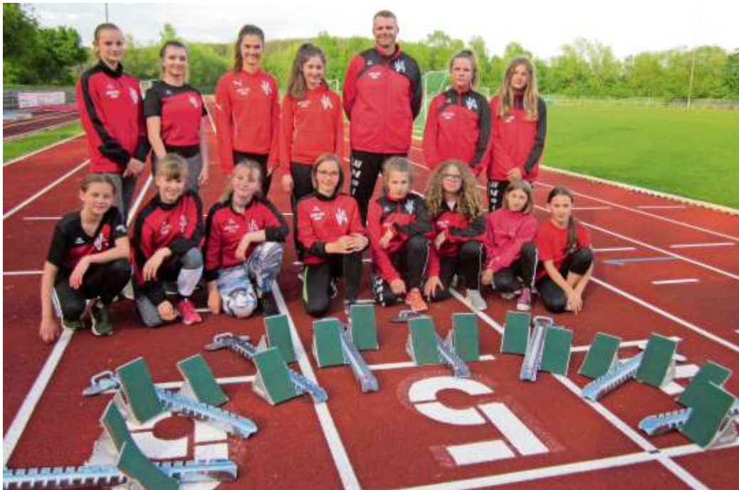
Die neuen Startblöcke, von der VR-Bank gespendet und von den Jungathleten präsentiert, für professionelle Sprintstarts.

Die neuen Wettkampfstartblöcke mit extra-hohen Abdruckpedalen eignen sich bestens für Kunststoffbahnen. Ihr Verstellmechanismus ist robust und ein-