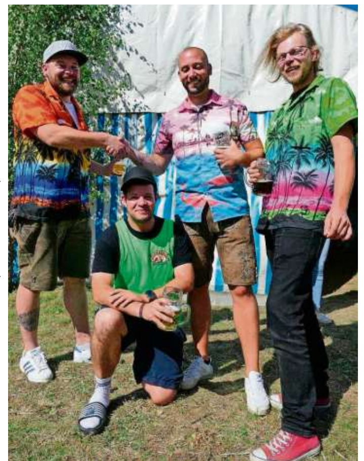
Die Motorsportfreunde Eisenbühl belegten beim diesjährigen Maßkrugrutschen den ersten Platz.