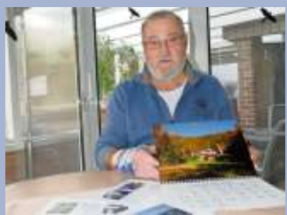
Höllental, Selbitz und mehr: 16. Fotokalender von Helmut Welte Seite 21