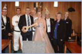
Rückblick auf den Rathaussturm in Naila und Bad Steben Seite 10,12