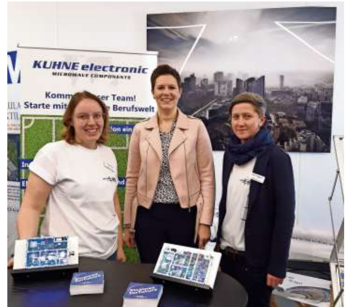
Auch die Firma Kuhne electronic bietet am Standort Berg interessante Arbeitsplätze mit optimalen Zukunftsaussichten und stellte sich auf der Ausbildungsmesse entsprechend dar.