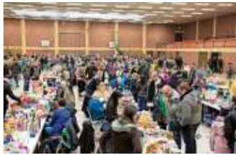
Spielzeugbasar der Frauen Union Naila am 23. November