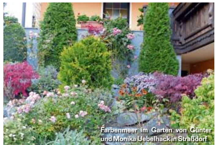
Farbenmeer im Garten von Günter und Monika Uebelhack in Straßdorf