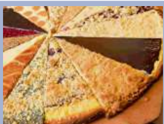
16 Frankenwald-Schmankerl auf der Consumenta ausgezeichnet Seite 25