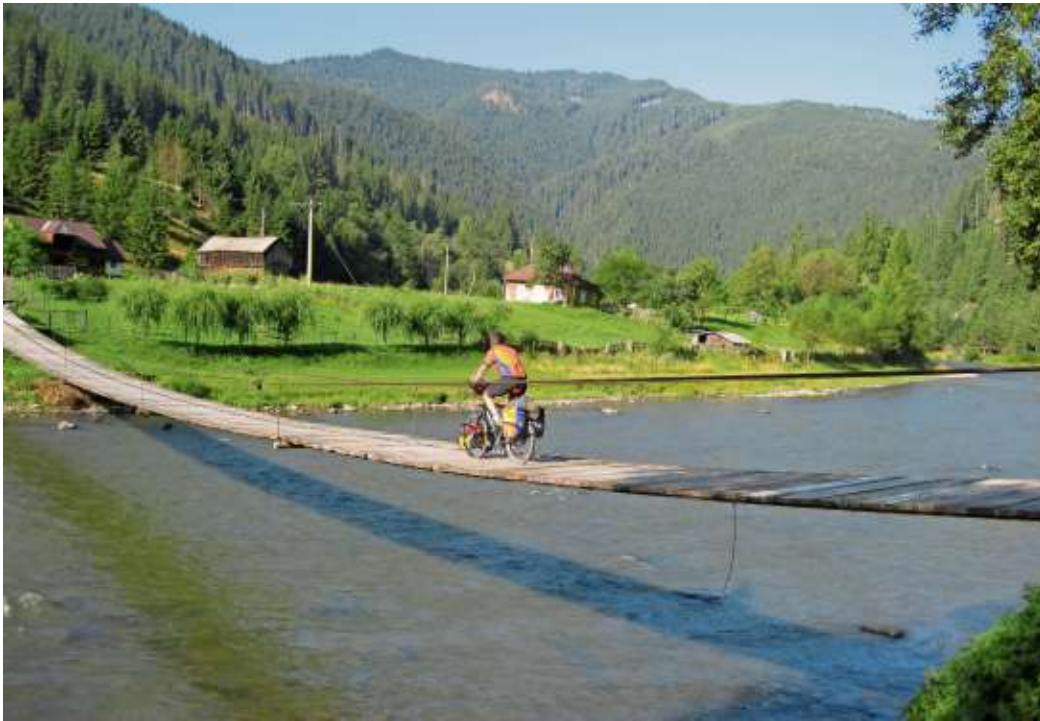
Mit dem Rad erlebt man diese fantastische Landschaft mit allen Sinnen.