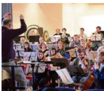
Jungmusiker gesucht: Jetzt fürs Jugendsymphonieorchester bewerben Seite 22