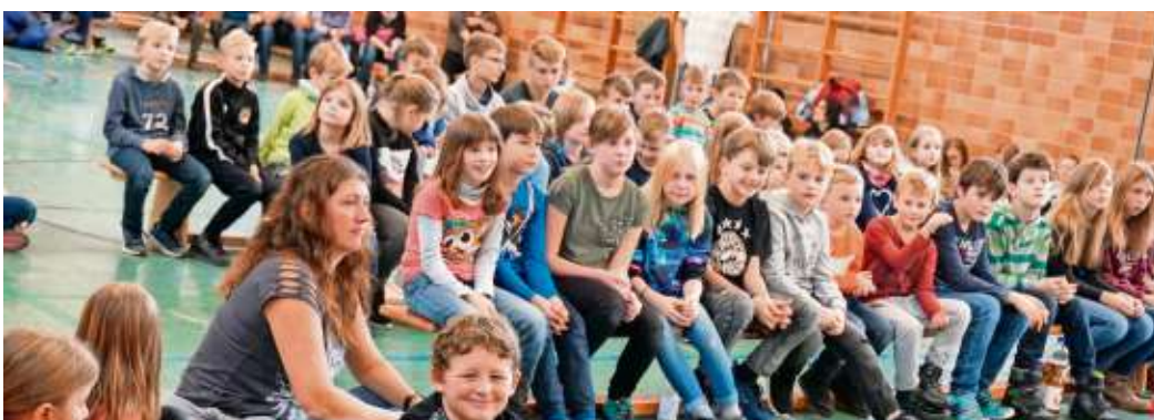
Nach dem Wettbewerb: Warten auf die Siegerehrung.