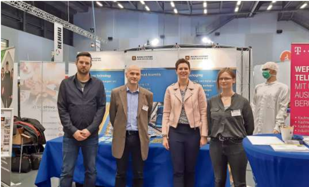
Die Firma MSE - eines von drei Top-Unternehmen aus Berg. Sie präsentierte sich mit einem Stand auf der 18. Hofer Ausbildungsmesse und zeigte so, dass die Gemeinde unter anderem ein Hochtechnologie-Standort mit attraktiven Arbeitsplätzen ist.