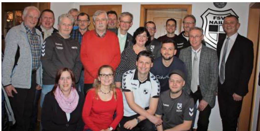
Das neue gewählte Team des FSV Naila

Die Neuwahlen der Vorstandschaft ergaben folgendes Ergebnis: 1. Vorsitzender