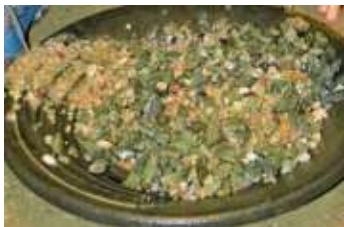
Ein spezielles Angebot des Stollens ist das Edelstein-Buddeln

Das Mundloch befindet sich links der Gaststätte Friedrich-Wilhelm-Stollen und auf der anderen Seite des Gebäudes ein kleines Bergbaumuseum, das auch der Startpunkt der Führungen ist.