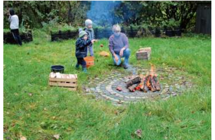
Die Jugendgruppe des OGV Döbra veranstaltete im Oktober ihr traditionelles Kartoffelfeuer. In diesem Jahr gab es neben Kartoffeln mit Quark auch eine leckere Kürbissuppe. Die Kinder konnten sich auf dem Gelände mit dem Lagerfeuer und Spielen beschäftigen. Das Foto links zeigt die jüngsten Teilnehmer, die Kartoffeln ins Lagerfeuer werfen, um sie später essen zu können. Das rechte Bild zeigt einen Teil der Gruppe beim Essen vor der OGV-Hütte.