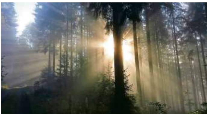
Plenterwald-Gesellschaften mit viel Abwechslung an Arten und Generationen gehört die Zukunft.

Noch nie war es so offensichtlich für Jedermann, und nicht nur für die Experten, dass der Klimawandel tötet. Vor allem schnell wachsende Sorten sollen Zukunftsbäume sein, wie damals die Fichte. Die vor Jahrtausenden vorherrschenden