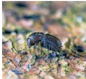
Der Borkenkäfer sorgt für große Schäden in Bayerns Wäldern

Waldbesitzer beantwortet der örtlich zuständige Revierleiter der bayerischen Forstverwaltung.