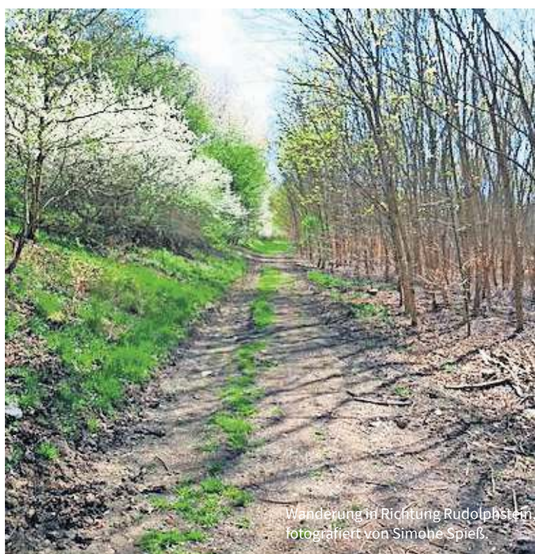
Wanderung in Richtung Rudolphstein