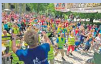
Walkingtag am 21. Mai 2023 im Kurpark Bad Steben