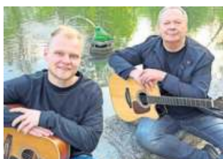
The Froschgräiners beim treten beim Nailaer Frühling auf