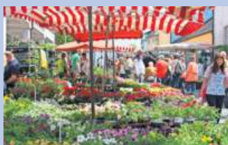
Viel geboten zum „27. Nailaer Frühling“