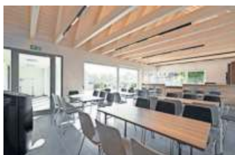
Auszeichnung fürs Dorfgemeinschaftshaus Carlsgrün