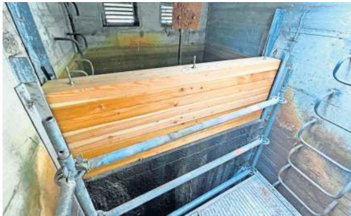
Ein Blick in das „Innere“ des Mönch nach erfolgter Reparatur.