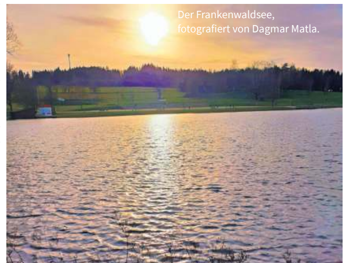
Der Frankenwaldsee.

immer mittwochs von 19:00 Uhr – 20:30 Uhr im Gemeindehaus Lichtenberg