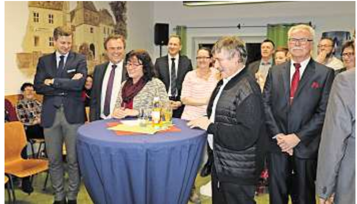
Rund 150 Besucher folgten der Einladung von Gemeinde und Kirchengemeinde zum gemeinsamen Start ins neue Jahr.