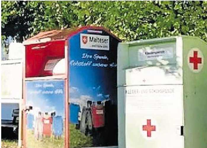
Die HvO Berg sucht nach Helfern für die Leerung der Altkleidercontainer.