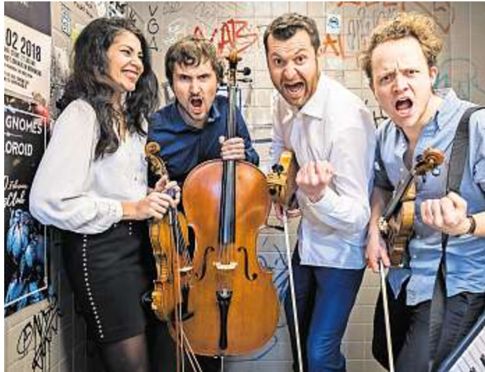
Vier Musiker aus vier Nationen - das Feuerbach Quartett präsentiert sein neues Showprogramm.

Bad Steben - Bombax heißt das neue Showprogramm des Feuerbach Quartetts. Vier Musiker aus vier Nationen, die es lieben, miteinander zu musizieren. Die mit atemberaubender Spielfreude Led Zeppelin, Prokofjew, Punkrock und Michael Jackson in einem klassischen Streichquartett vereinen und so den Begriff Kammermusik neu definieren. Zu den Beatles wird gesungen, zu Ed Sheeran geklatscht, zu Muse gepfiffen. Dem Feuerbach Quartett gelingt es wie kaum einem anderen Ensemble, seine Leidenschaft und Freude an der Musik unmittelbar auf das Publikum zu übertragen. Bereits mit seinem zweiten Album „Knights and Fools“ fand das mehrfach preisgekrönte Quartett Einzug in das nationale und internationale Konzertgeschehen, begleitet von einem lauten Presseecho und zahlreichen Rundfunkbeiträgen. Im Juni 2018 veröffentlichte das Feuerbach Quartett sein drittes Studioalbum „Bombax“. Handgemachte Arrangements bilden das Grundgerüst der Tracklist, ergänzt durch Filmmusik und Eigenkompositionen. Damit gelingt dem Quartett erneut eine