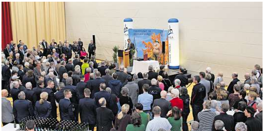
Über 600 Gäste kamen zum Neujahrsempfang in die Frankenhalle.

und können uns eine Meinung bilden. Allerdings sind Zweifel erlaubt, inwieweit uns bewusst in die Welt gesetzte Falschmeldungen, die sogenannten „Fake News“ dabei beeinflussen.“ so Stumpf, der bei aller Verbesserung der technischen Kommunikation die Erkenntnis des englischen Naturforschers Isaac Newton aus dem 18. Jahrhun-