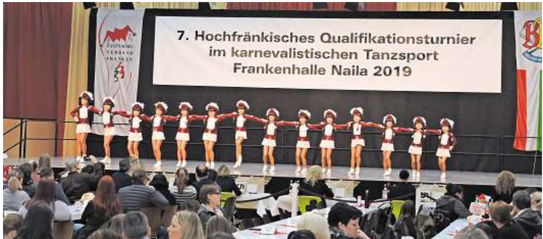
Auch die Gardetänzerinnen des TuS Lippertsgrün kämpften um Punkte.