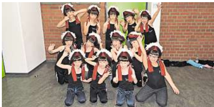
Gelöste Stimmung hinter der Bühne: Die TuS-Gardetänzerinnen.

Aktiven auf der Bühne, um die Bewertungsjuroren von ihrem Können und ihrem Tanz zu überzeugen und die höchstmögliche Punktzahl zu erreichen, denn schließlich ging es um die „Quali“, ob nun für die Solisten, die Paare oder die Garden wie Schautanzgruppen. Den sieben Jurorinnen und Juroren blieb dabei nicht der kleinste Fehler verborgen; Unregelmäßigkeiten in der Ausführung wurden genauso geahndet wie die Musik, Uniform und Mimik. Was für den Betrachter leicht aussah, ist in Wahrheit eine Leistungssportart, die den Tänzerinnen und Tänzern alles abverlangt. Viel Fleiß und Training gehören zu einem Tanz und nach dem kurzen intensiven Bühnenauftritt pumpt