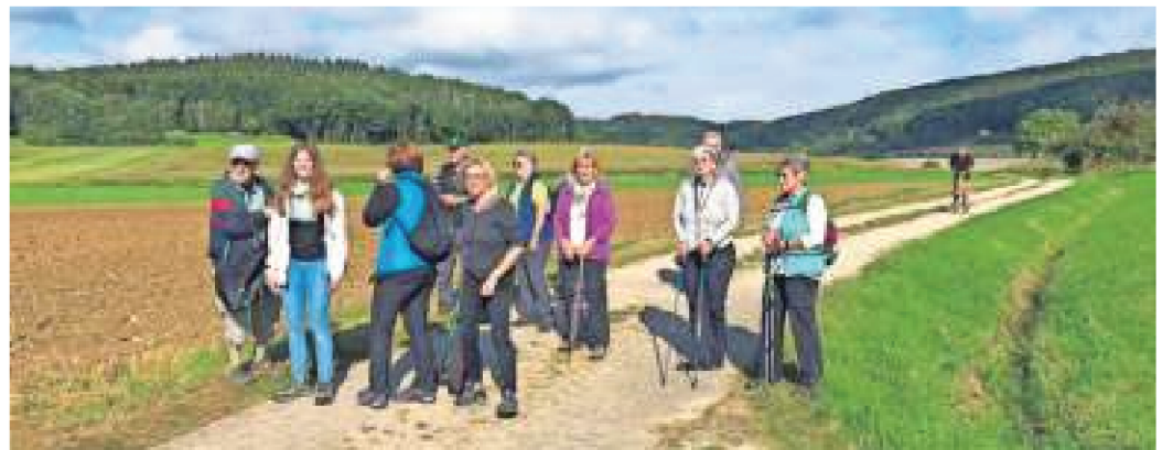
Bei herrlichem Wetter waren wir an einem Sonntag mit etlichen Wanderern im Bamberger Land unterwegs.