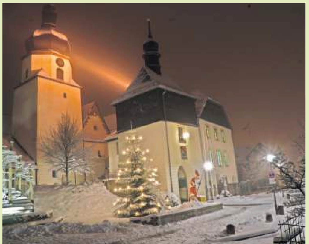
Das vorweihnachtlich-verschneite Berger Rathaus hat WIR-Leser Erich Simon aus Issigau fotografiert.