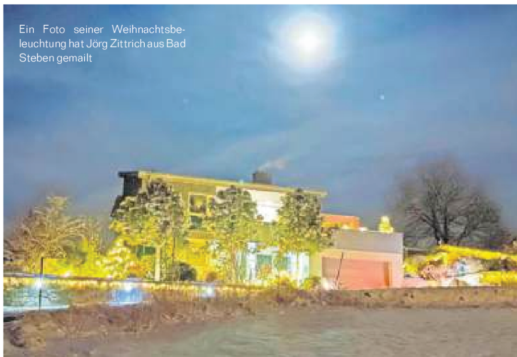
Ein Foto seiner Weihnachtsbe- leuchtung hat Jörg Zittrich aus Bad Steben gemalt