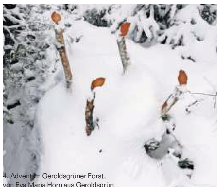
4. Advent im Geroldgrüner Forst, von Eva Maria Horn aus Geroldgrün