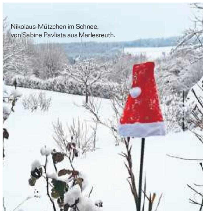
Nikolaus-Mützen im Schnee, von Sabine Pavlista aus Marlesreuth.

In der letzten Ausgabe des Jahres 2021 präsentieren wir Ihnen einige Winterbilder, die uns bisher erreicht haben. Die WIR-Redaktion wünscht allen Lesern ein wunderschönes Weihnachtsfest und einen guten Rutsch nach 2022.