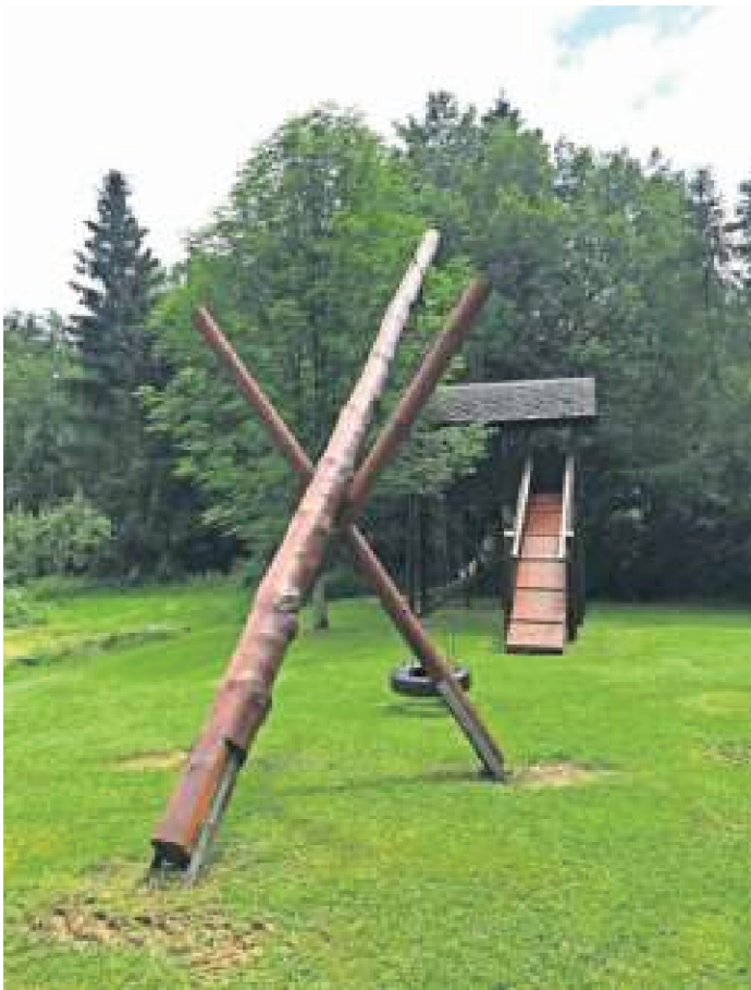
Ohne Arbeitseinsatz am Wanderheim geht es nicht. Die große Schaukel und die Rutsche wurden mir vereinten Kräften erneuert.