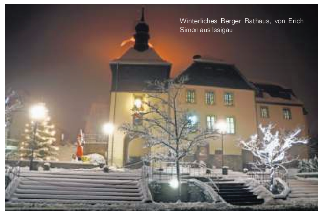
Winterliches Berger Rathaus, von Erich Simon aus Issigau