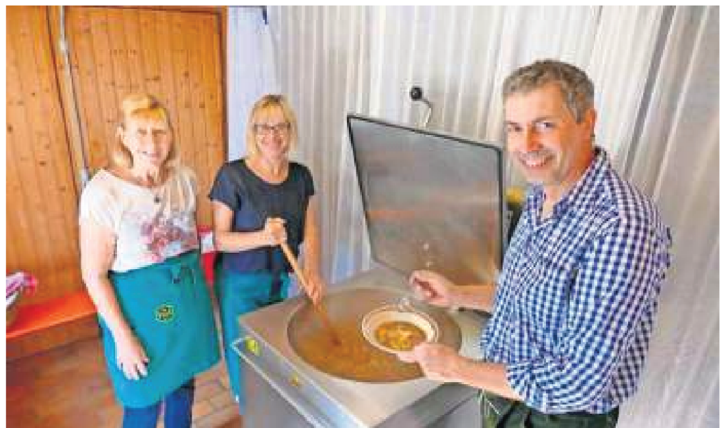
Traditionell bei herrlichem Wetter wurde am ersten Septembersonntag die Schwammakärwa gefeiert.