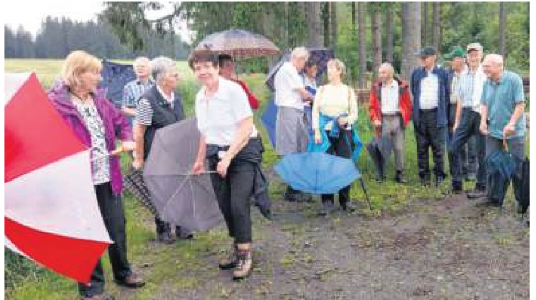
Trotzdem das Wetter manchmal schlecht war, waren die Seniorenwanderer an fast allen Donnerstagen in diesem Jahr unterwegs.