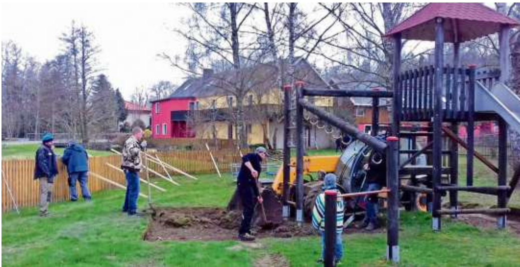
Auch in Tiefengrün (links oben), Bruck (links unten) und Gottsmanngrün (Foto oben) wurde gewerkelt.