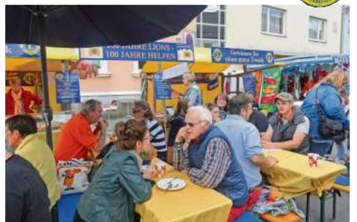
Gut besucht war der Lions-Stand beim Nailaer Frühling 2018.

Die Mitglieder des Lions Clubs hat auch wieder viele Kuchen und Torten gebacken, die zusammen mit einer Tasse Kaffee oder einem Glas Wein den ganzen Tag über angeboten werden. Die Stände sind wie immer in der Kronacher Straße vor dem Café Puccini zu finden. Zu 100 Prozent kommt der Erlös aus diesen Verkäufen wohltätigen Zwecken zugute, denn die Lions engagieren sich unentgeltlich