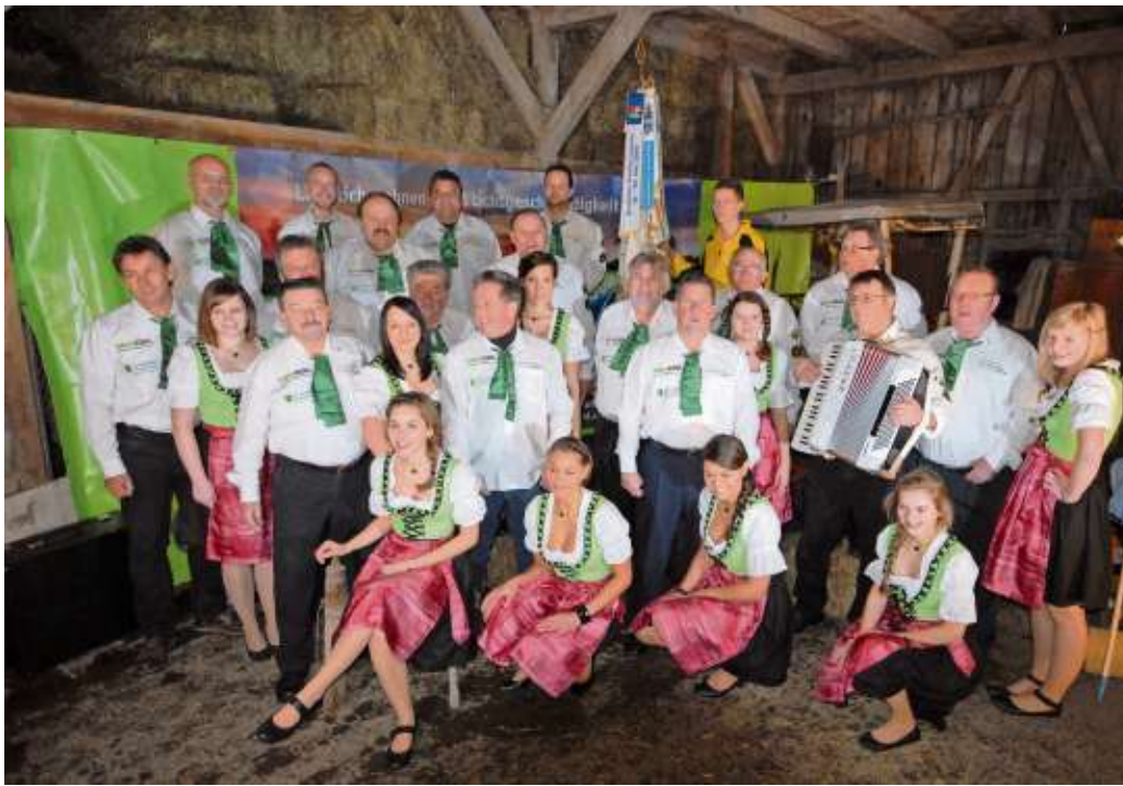
Das Foto zeigt die AdelbergBoum mit Mädels der Yellow Diamonds in Dirndl bei der Fotosession in der „Eisel-Scheune“ aus dem Jahr 2011.