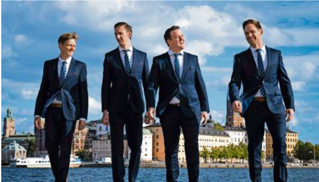
Die Ringmasters kommen aus Stockholm in den Kurhaussaal Bad Steben.