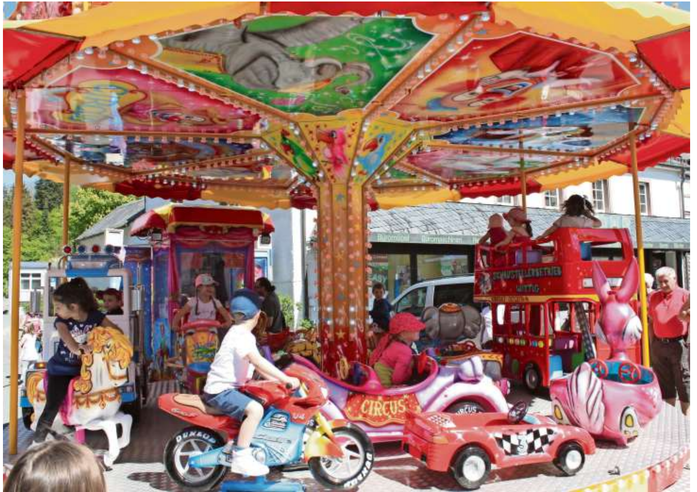
Hüpfburg, Kinderkarussell oder Ponyreiten - auch für die kleinen Marktbesucher ist wieder allerhand geboten.

„Viel los“ in Naila ist also am Sonntag, 19. Mai, wenn die Werbegemeinschaft der Nailaer Einzelhändler „Die Ozünder“ gemeinsam mit der Stadt Naila zum „25. Nailaer Frühling“ einladen. Seien Sie mit dabei!