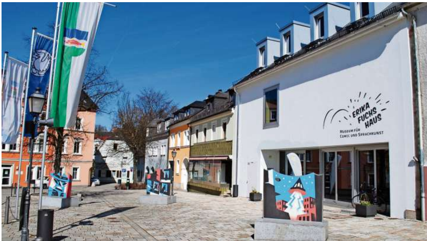
Beim Museumstag mit dabei: Das Erika Fuchs Haus in Schwarzenbach an der Saale und das Deutsch-Deutsches Museum in Mödlareuth.