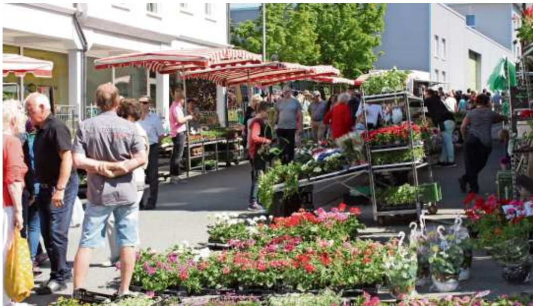
Ein Meer an Blumen begrüßt die Besucher beim Nailaer Frühling am Sonntag.

Gleich noch ein Grund zum Feiern: Anlässlich des 150. Jubiläums der Feuerwehr der Stadt Naila werden sich die Feuer-