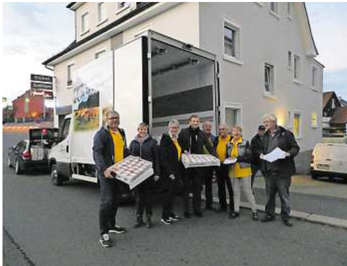
Das Foto zeigt einige der Lions-Freunde beim Verteilen der Krapfen.

Das Interesse war bereits im ersten Jahr groß: Damals wurden 3.025 von den Chefs an die Mitarbeiter verschenkt - und das für den guten Zweck. Und dieser Erfolg setzte sich über die Jahre hinweg fort: Das ist beibehalten worden und dass es ankommt, zeigt allein schon die stolze Zahl von 10.077 Krapfen. Bereits ab 7 Uhr standen „Lions“ vor den Backstuben, um die Krapfen in Empfang zu nehmen und diese an Firmen, Behörden, Banken, Einzelhändler, Arztpraxen und