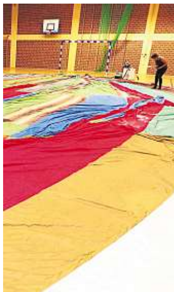
Restaurierung des Ballons 2017.

Naila - Am Sonntag, 18. November, endet die erfolgreiche Sonderausstellung „Ballonflucht“ im Nailaer Museum, mit interessanten Gästen. Zeitzeugen, die aktiv in die Ereignisse des 16. September 1979 eingebunden waren, schildern ihre Erlebnisse. Die Filme „Der Wind kommt von Norden“, mit Günter Wetzel, er kommt persönlich, und dem Originalfilm „Wir sind im Westen“ von Gerd Rauner, ergänzen die Erzählungen. Die bisher bekannten Filme enden mit der Bestätigung, im Westen zu sein, durch eine Polizeistreife. Was aber dann geschah, ist allgemein unbekannt. Über die Aufnahme der Geflüchteten auf der Polizeiwache Naila und den ersten