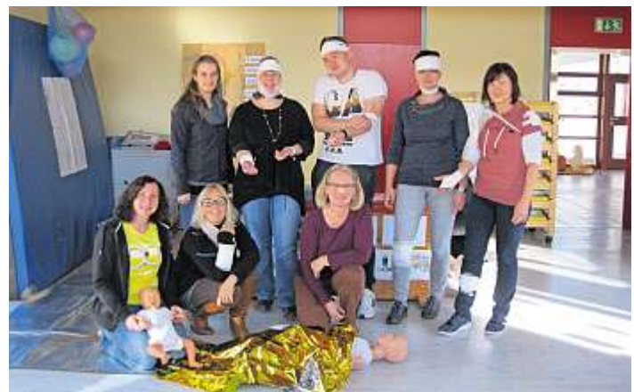
Das Team der Jakobuskita absolvierte einen Erste Hilfe-Kurs am Kind