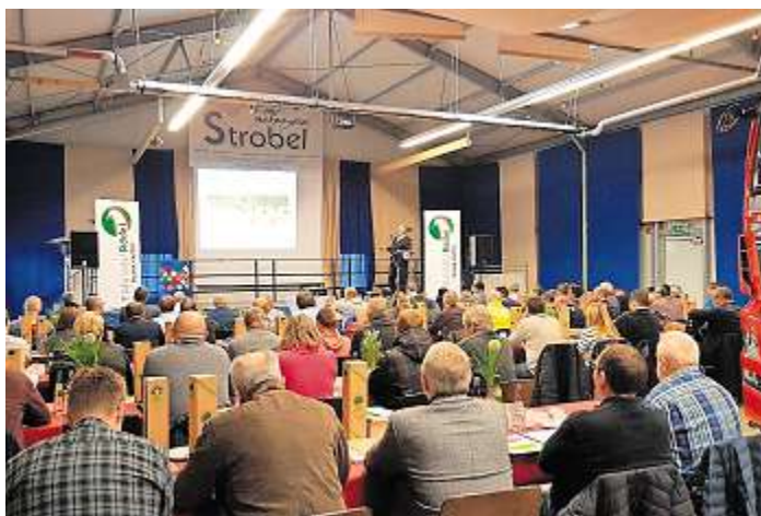
Ein Blick in die Eventhalle Strobel auf Teilnehmer, Referenten und Fahrzeuge.

Er betonte, dass der Transport gefährlicher Güter von allen Beteiligten ein Höchstmaß an ak-