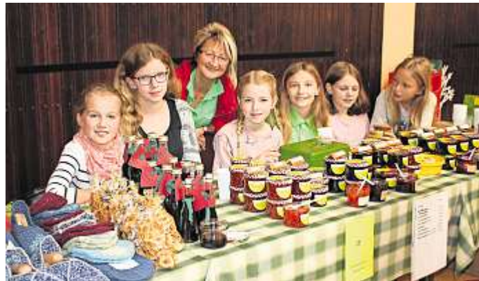
Natürlich gab es unter anderem auch selbst gemachte Marmeladen.

Naila - Alle zwei Jahre findet in Naila ein Kreativmarkt statt. In diesem Jahr war es wieder so weit und zahlreiche Hobbykünstler zeigten ihre Arbeiten, die in mühevoller Heimarbeit angefertigt und einem breiten Publikum präsentiert wurden. Bereits zum elften Mal kamen alte, aber auch neue Aussteller in die Nailaer Frankenhalle, um dem Publikum von Klein bis Groß und von Jung bis Alt ihr