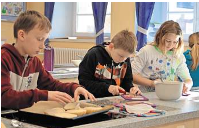
In der Schulküche wurden Pizzasemmeln gemacht.