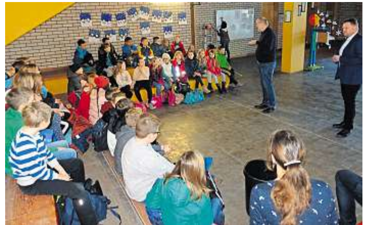
Begrüßung in der Aula durch Bürgermeister Reiner Feulner.