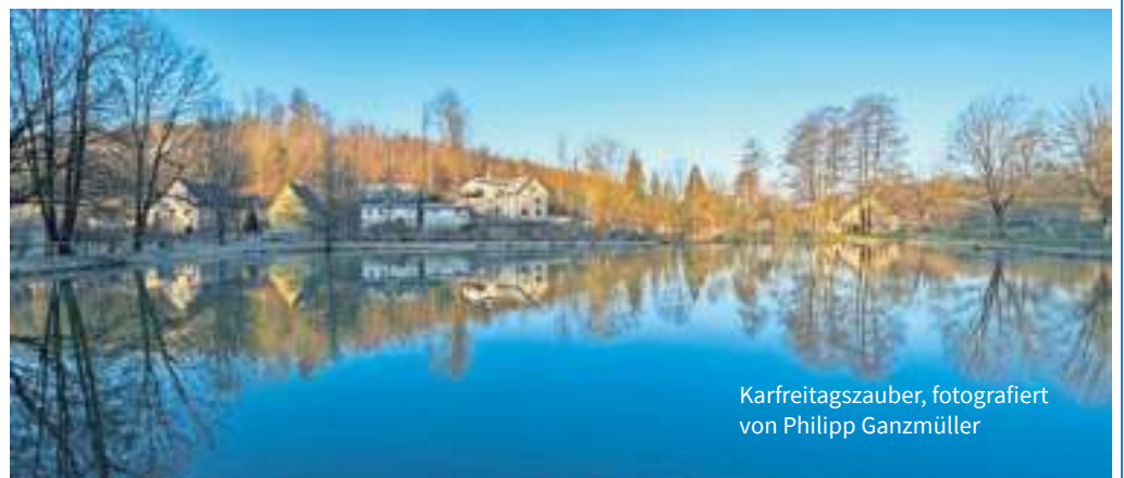
Karfreitagszauber, fotografiert von Philipp Ganzmüller