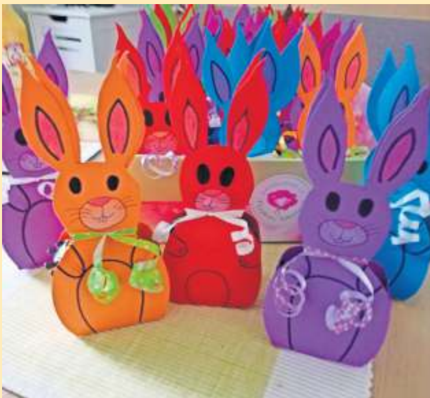
Osterüberraschung: Gebastelte Geschenke für die „Junggebliebenen Runde“ in Froschgrün, fotografiert von Ingeborg Stiels.