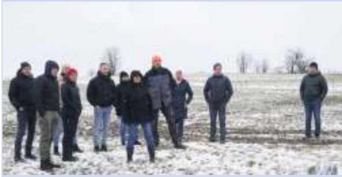
Bürger für Bürger auf der Dexter Weide