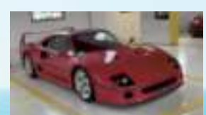
Ferrari Museum oder Modena