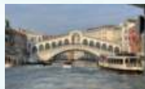
Mit dem Schiff nach Venedig

Folgende Ausflüge mit Reiseleitung sind inklusive: