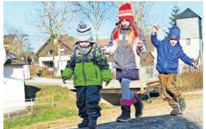
An dieser Station ist Balance gefragt

Highlight, auch die Kinder, die momentan die Einrichtung leider nicht besuchen können, gibt's nun eine Dorfrallye. Für die Teilnahme einfach einen Laufzettel