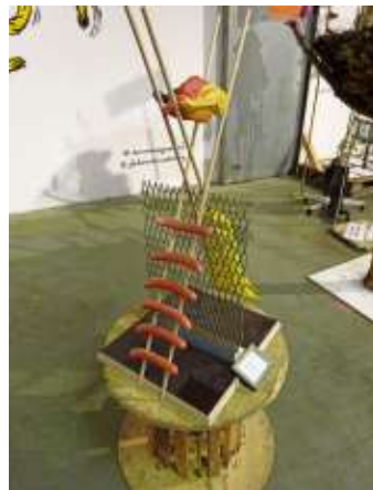
Nachdenkliches zur Wiedervereinigung: Die Arbeit 3. Oktober.

Auch der Zapfenstreich, eine militärische Zeremonie, wurde mit der Installation „Goodbye Ursula“ satirisch beleuchtet.