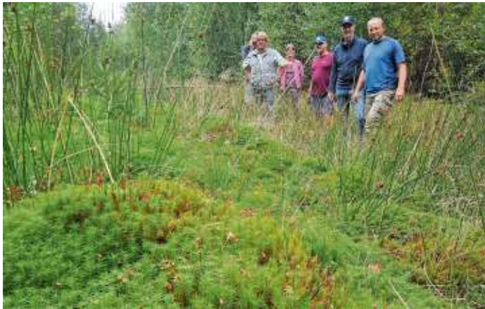
Prächtige Torfmooskissen und Seggengräser. Ein Zustand, der sich nach wenigen Jahren richtiger Pflege einstellt.

Froschbachtal - Die Ortsgruppe Frankenwald Ost des Bund Naturschutz in Bayern e.V. hat mit einem Duzend Helfern einen Teil des BN eigenen Grundstücks im Froschbachtal entbuscht. Die Herausnahme von Fichten und Birken fördert die Ausbreitung der Torfmoose. Diese können bis zum Dreißigfachen ihres Trockengewichtes an Wasser speichern. Sie zählen zu den effektivsten Bodenbefeuchtern und sind als Moorbildner gleichzeitig ein sehr wichtiger CO 2 -Speicher. Den Helfern ist bei der schweißtreibenden Arbeit so mancher Moorbewohner aufgefallen: Dickkopf- und Prachtlibellen, Köcherfliegen und auch Grasfrösche. Diese sind im Gegensatz zu ihren grünen Verwandten hellbeige bis braun und leben in feuchten Waldgebieten. Die im Biotop gelegenen Teiche haben sich nach vielen Jahren der naturschutzfachlichen Pflege