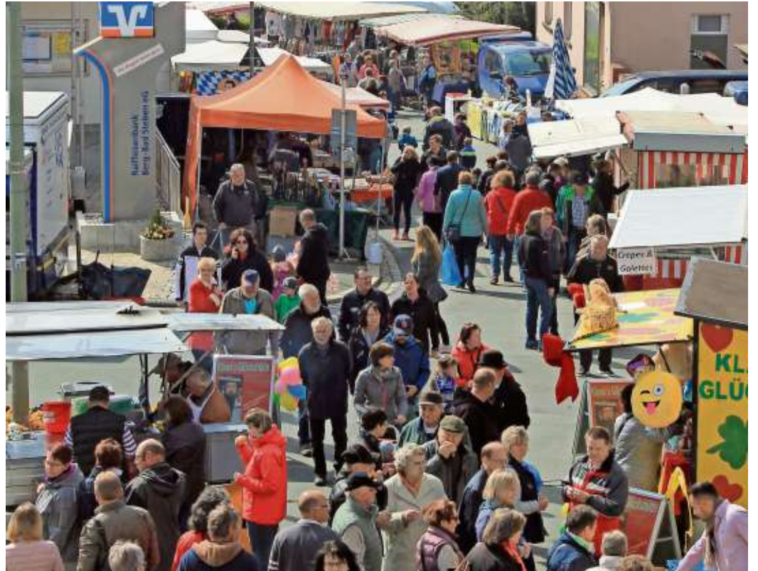
Am Sonntag, 13. Oktober, lädt der Markt Bad Steben ab 08.00 Uhr wieder zur traditionellen Herbstkirchweih ein.

litäten. An diesem Tag laden auch die Geschäfte in Bad Steben zum Verkaufsoffenen Sonntag ein. Nach dem Marktbummel kann man noch einen Spaziergang durch den herbstlich bunten Kurpark genießen und um 15.00 Uhr ertönt in der Lutherkirche anlässlich der „Stemmer Herbstkärwa“ die 34. Bad Stebener Marktmusik. Noch ein Tipp: Völlig ohne Stress gelangt man mit der Bahn nach Bad Steben; stündlich ab Hof und das Beste ist, der Bahnhof liegt direkt am Beginn des Marktgebietes!