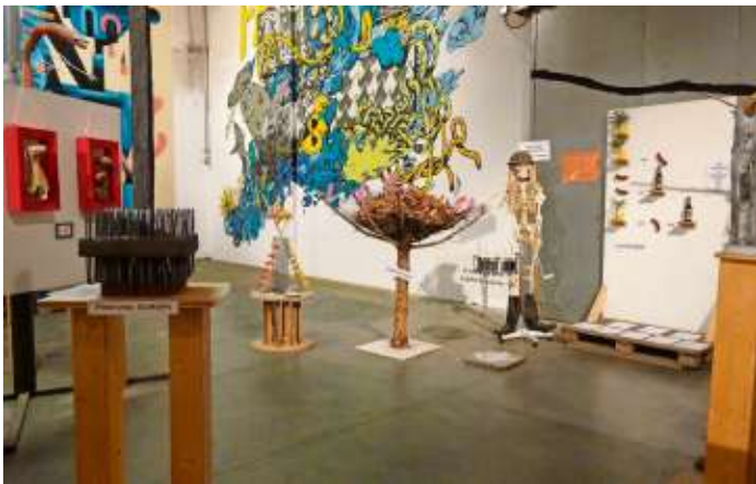
Goodbye Ursula: Mit dieser Installation wurde der Zapfenstreich satirisch beleuchtet.

Hof/Bad Steben - 6.000 Quadratmeter, 80 Künstler, drei Tage Zeit: Das war die Hoftexplosion, die Anfang Oktober zum fünften Mal in den Hoftex-Hallen in der Hofer Schützenstraße stattfand.