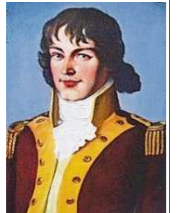
AvH in der Uniform eines preußischen Bergbeamten; Gemälde: Cortes / v. Sallwürk, Ausschnitt Quelle: Bergbaumuseum Bochum

wissenschaftlichen Fragen, besonders zwischen Deutschland