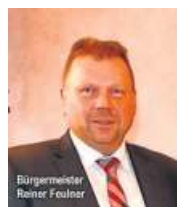
Bürgermeister Reiner Feulner