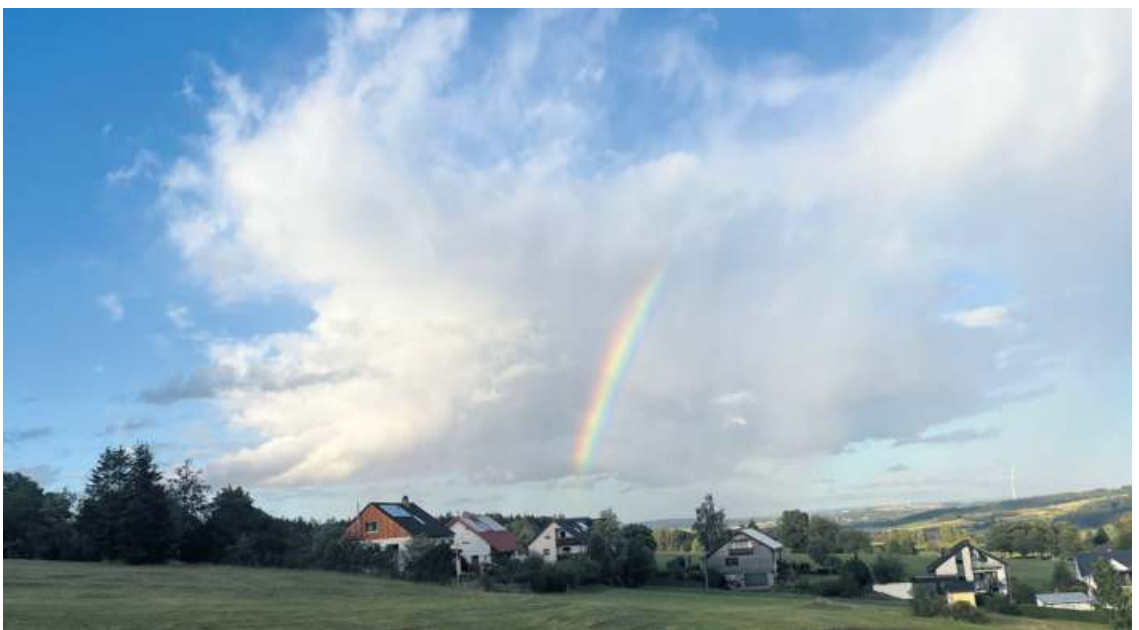
... fotografiert von WIR-Leserin Sylvia Mahall.