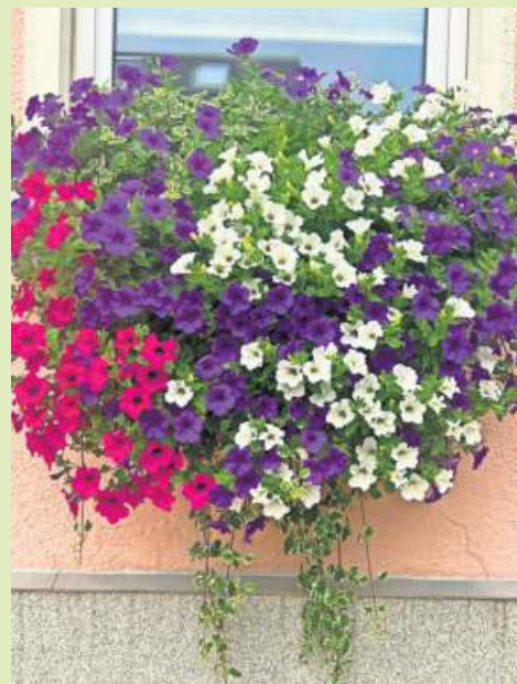
Die Blumenpracht der Familie Strobel aus Bad Steben, fotografiert von Daniela Strobel.