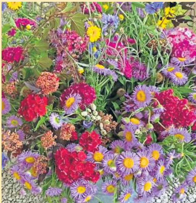
Ein bunter Blumenstrauß