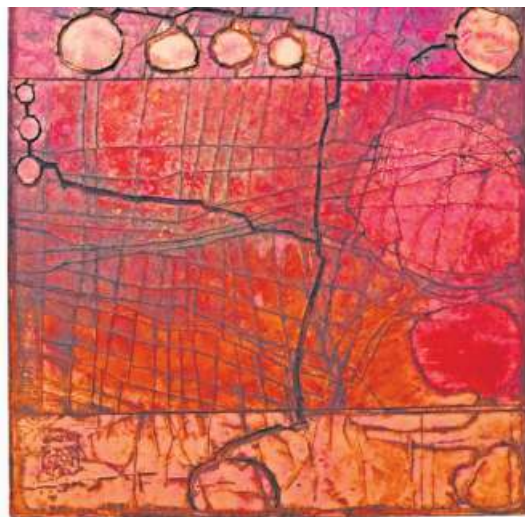
Gerd Kanz, Kiss me over the garden gate, 2020, Öl auf Holz, 80 x 80 cm.

Einmalig und unverwechselbar ist das Werk des unterfränki-