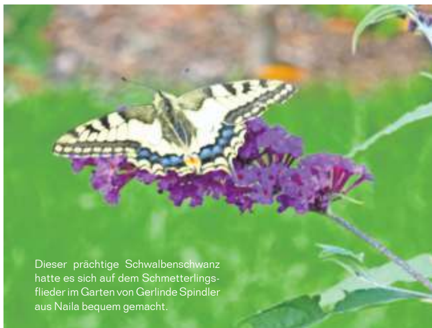
Dieser prächtige Schwalbenschwanz hatte es sich auf dem Schmetterlingsflieder im Garten von Gerlinde Spindler aus Naila bequem gemacht.