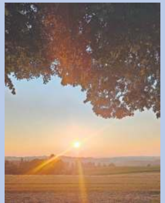
Sonnenuntergang bei Birnbaum.

Die geltenden Hygiene- und Verhaltensregeln für Jugendan- gebote, für Angebote für Erwachsene sowie für die Sport- arbeit sind auf der Webseite www.cvjm-naila.de veröffent- licht.