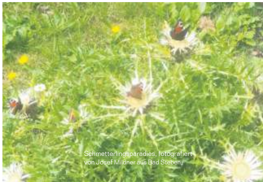
Schmetterlingsparadies, fotografiert von Josef Mildner aus Bad Steben.