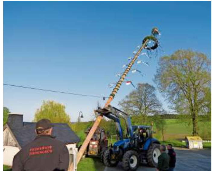
Das Bild zeigt das Aufstellen des Maibaums in Tiefengrün, das hier mit zwei Traktoren örtlicher Landwirte und einer Seilwinde erfolgte.

schiedenen Ortsteilen wurden auch traditionelle Maifeuer entzündet, die am relativ kühlen 30. April den Festbesuchern wohlige Wärme spendeten. Ein herzliches Dankeschön gilt allen Ehrenamtlichen, die mit dem Aufstellen der Maibäume zur Verschönerung der Gemeinde Berg beitragen und Gemeinderat Michael Grosch, der auch in diesem Jahr ehrenamtlich die Maibaum-Prüfung durchgeführt hat.