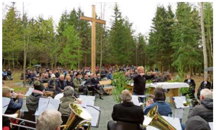
Viele waren gekommen, um bei der Segnung des Wald- und Naturfriedhofes mit den Standorten Naila und Issigau, dabei zu sein.