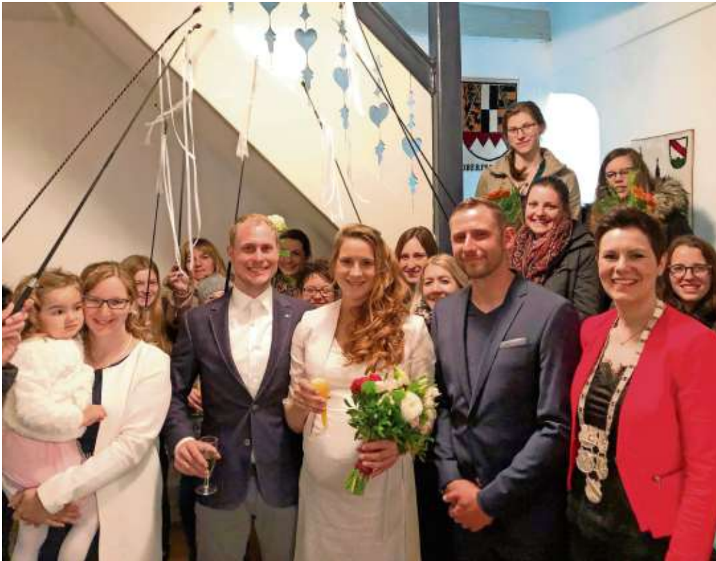
Ja-Wort im Standesamt Berg