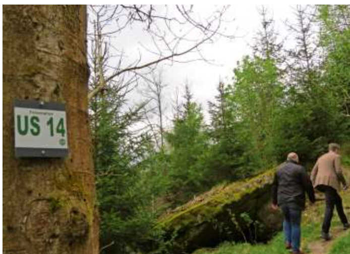
Mit US 14 ist der Felsenpfad gekennzeichnet.

Der Felsenpfad zieht sich vom Fahrweg am westlichen Ufer der Selbitz über den Hang des Kessel- und Drachenfelsens empor und endet wieder auf dem Talweg. Er macht seinem Namen alle Ehre. Nach jeder Krümmung bieten sich neue Ausblicke. Bizarre Felspartien und Bäume, die förmlich aus den Felsen wachsen überraschen immer wieder. Einzelne Felsbrocken, daneben große und weniger große Blockmeere zeugen davon, dass die Verwitterung auch dem harten Diabas in langen Zeiträumen dem harten Gestein beizukommen vermag. Infotafeln informieren über den Bergbau und die Geologie. Wer den äußerst schönen und interessanten Rundweg erwandern will, sollte in festem Schuhwerk einigermaßen trittsicher sein.