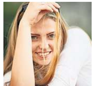
Der Workshop „Helden der Heimat“ findet am 16. März in Hof statt.

Kräfte in sozialen Organisationen und Verbänden, Bildungs- und Kultureinrichtungen, die mit Ehrenamtlichen arbeiten oder in Zukunft arbeiten möchten. Weitere Informationen zum Workshop, dem Wettbewerb und die (kostenfreie) Anmeldung unter www.oberfranken.heldenderheimat.de . Fragen beantwortet die Adalbert-Raps-Stiftung unter helden@raps-stiftung.de oder 09221/807 0.