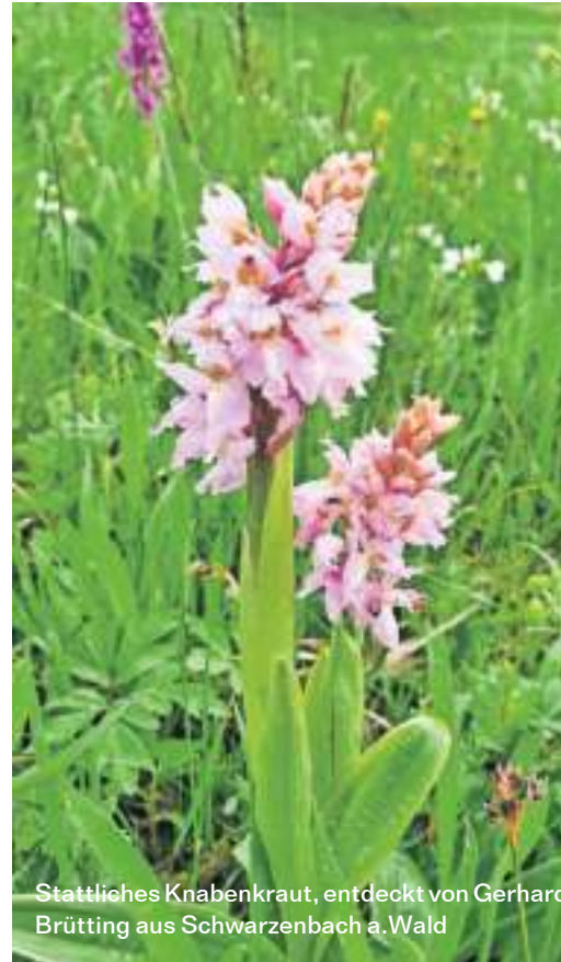
Stattliches Knabenkraut, entdeckt von Gerhard Brütting aus Schwarzenbach a. Wald