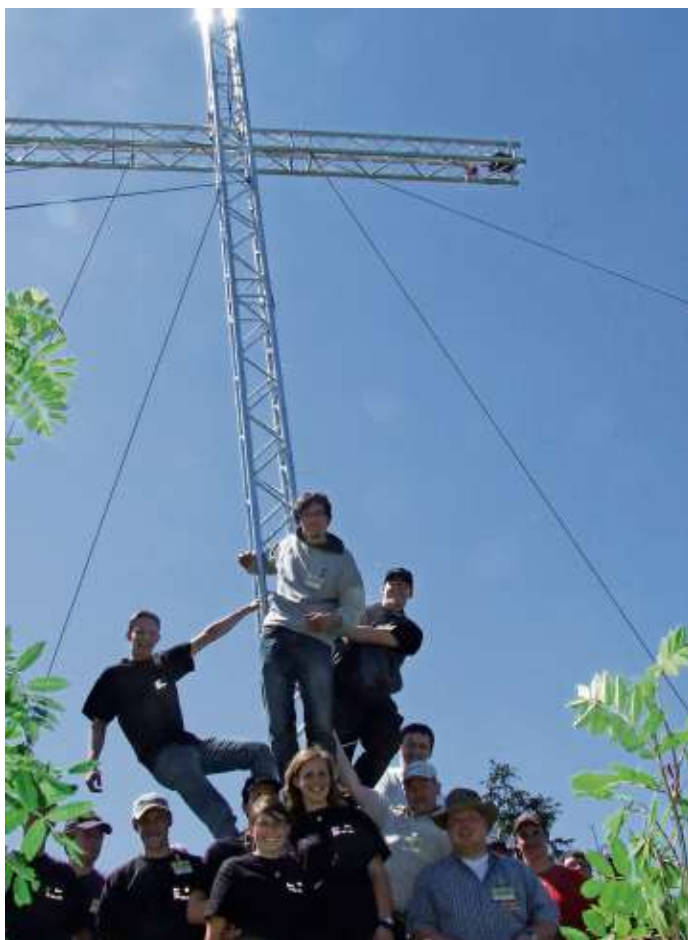
Das Kreuz auf dem Berg bei Thierbach lädt seit einigen Tagen ein.

voll mit leckerem Essen. Rund 200 freiwillige Helfer sorgen dafür, dass alles klappt.