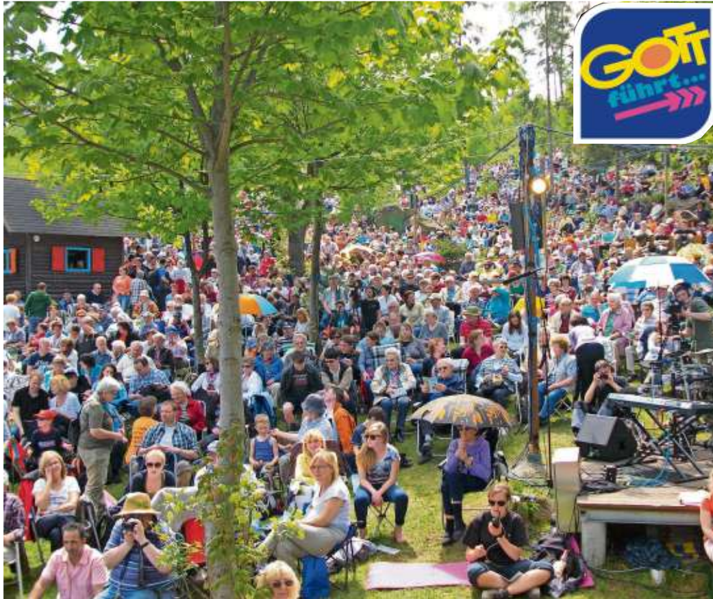
Tausende Teilnehmer werden am kommenden Wochenende zur 74. Pfingsttagung erwartet.

Die circa 2.000 Dauerteilnehmer campieren in großen Zeltlagern oder schlafen in umliegenden Gemeinde- und Vereinshäusern. Eine eigene Tagungsküche versorgt alle liebe-