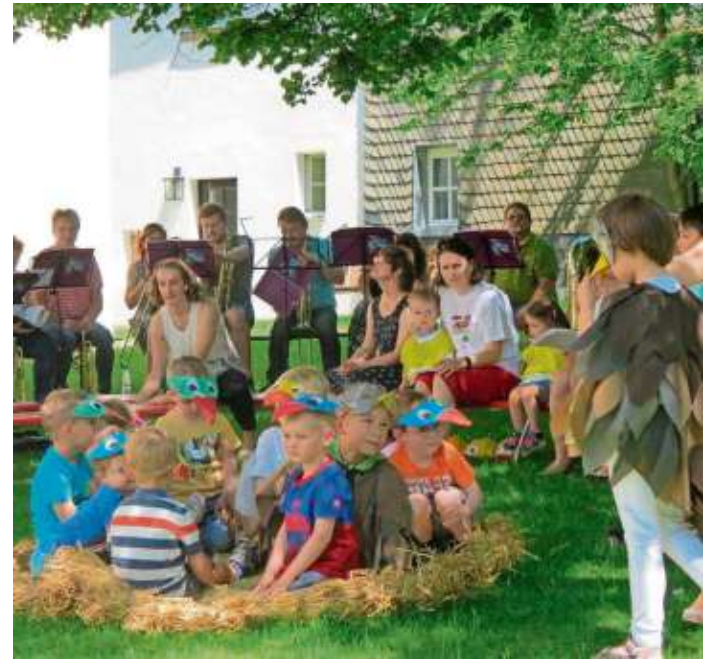
Aufführung der Jakobus Kita Berg