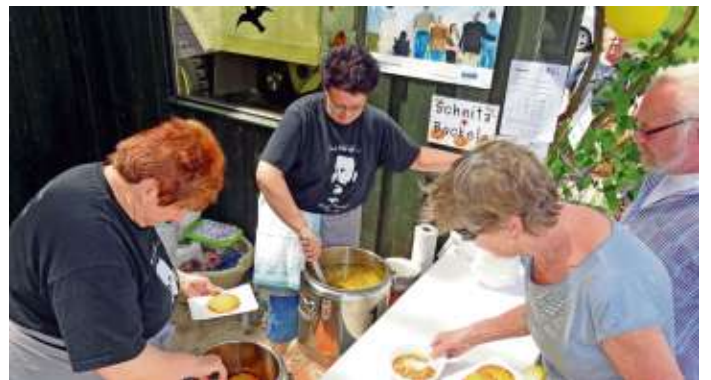
Schnitz und Baggele

heit zu einem Ausflug sowie einem Austausch unter Freunden an diesem herrlichen Tag nutzten. Für die traditionsgemäß durchgeführten Rundflüge standen ein Motorsegler sowie ein Leichtflugzeug bereit und stellvertretender Kreisvorsit-