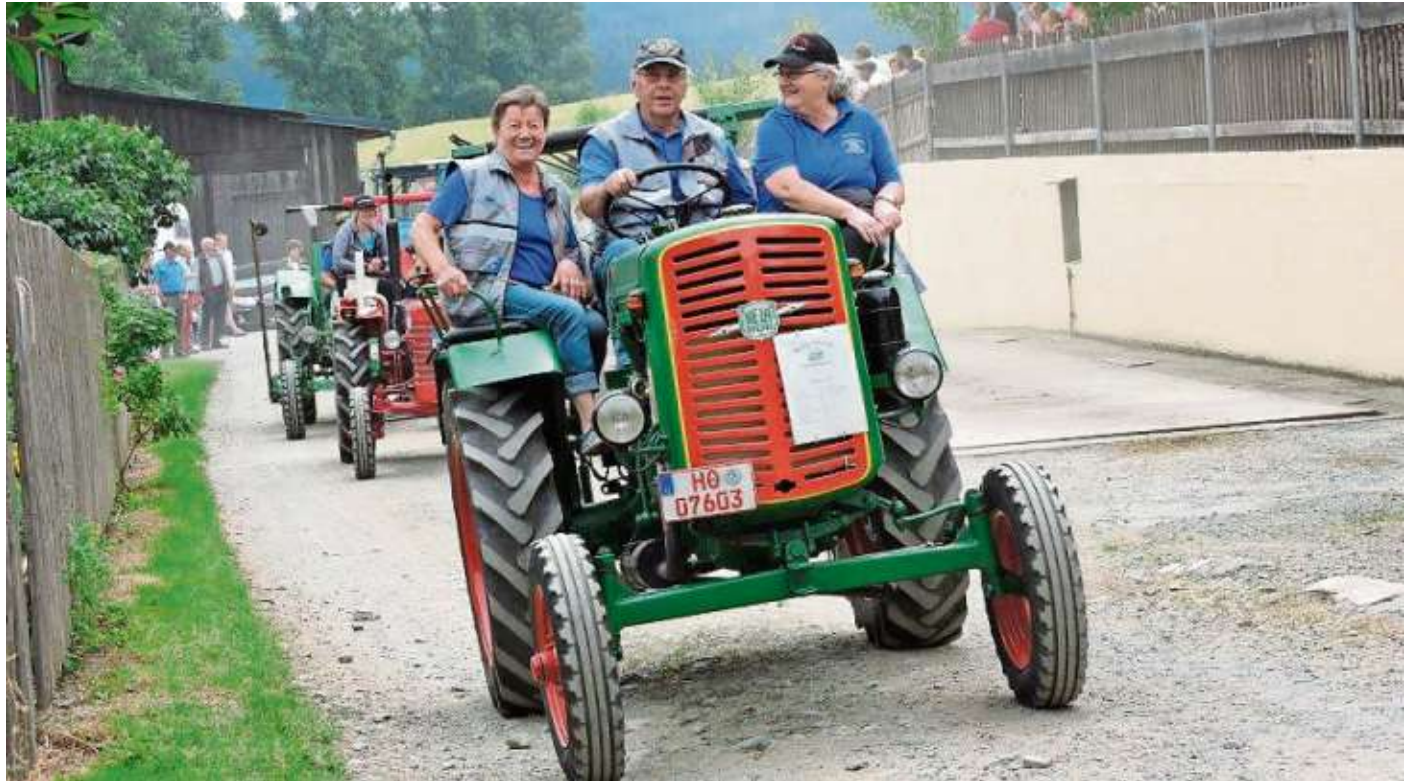
Am Gutshof der Familie von Reitzenstein wird am 15. und 16. Juni wieder gefeiert - mit dem Traktortreffen, Musik und Tanz.

Weiter geht's dann am 17 Uhr mit der Neuauflage des seit ein paar Jahren ausgesetzten Traktorenwettziehens. Eingeladen sind Vereine, Stammtische, Firmen oder auch ein Team aus Kumpels, die sich mit maximal acht Teilnehmern der Heraus-