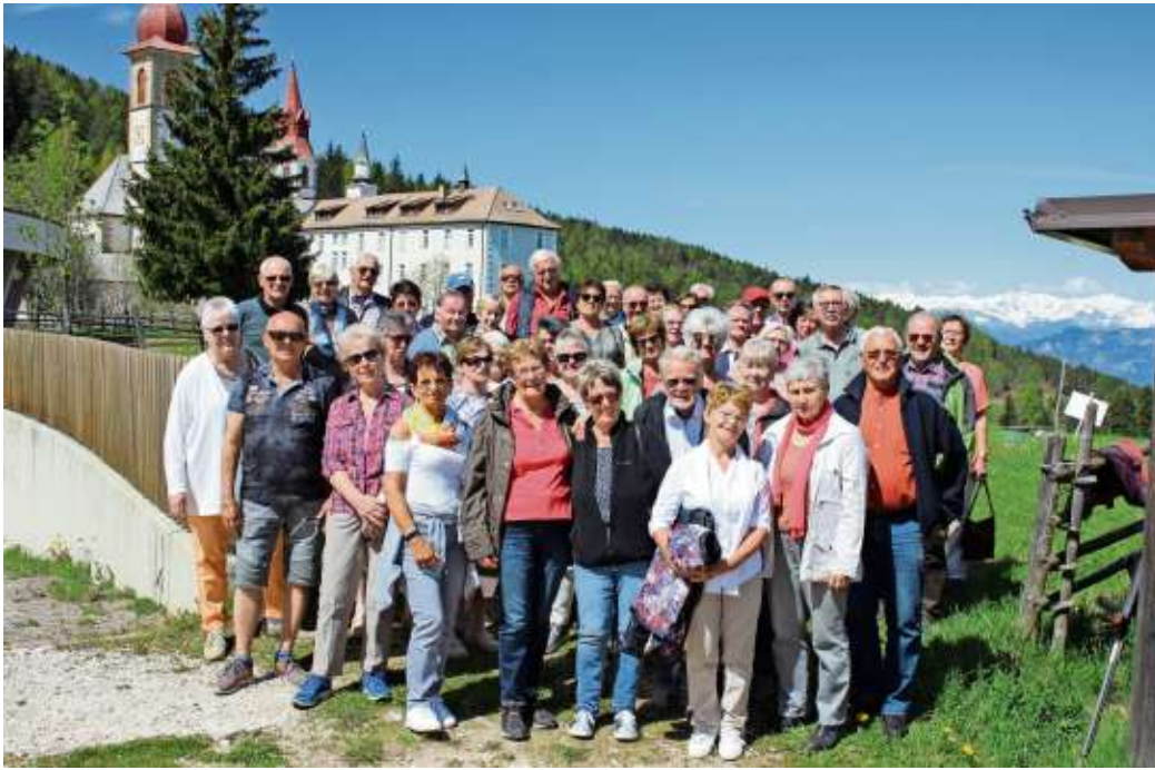
Das Foto zeigt die Reisegruppe aus Culmitz und Döbra in Villanders.