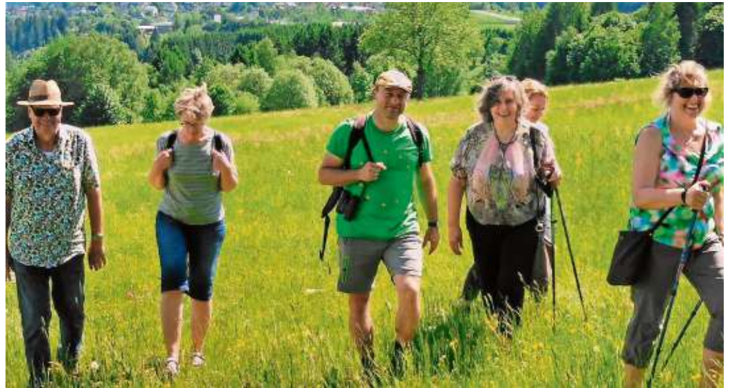
Herrliche Magerwiesen und fantastische Blicke, wie hier auf Nordhalben.