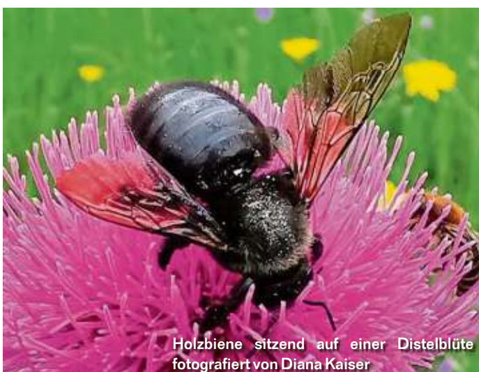
Holzbiene sitzend auf einer Distelblüte