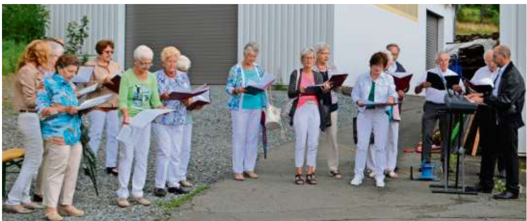
Der Kirchenchor sang zum Abschied

gern. Gemeinsam sitzt man am Tisch, teilt die Gaben, reicht die Speisen weiter und jeder wird gesättigt.