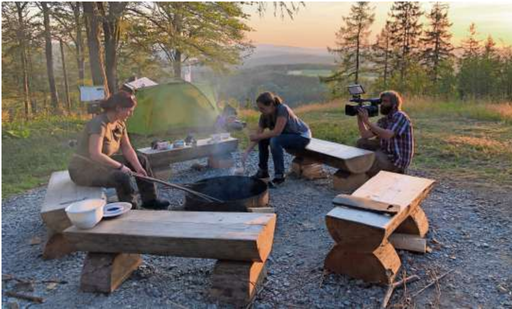
Für einen Filmdreh kam das Team von SAT.1 Bayern in der Frankenwald.