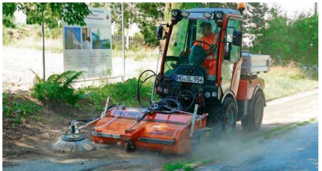
Von der Spende wurde unter anderem eine Kehrmaschine für den städtischen Bauhof angeschafft.

„Ihr habt einen wesentlichen Anteil durch eure Arbeiten und durch eure Spende an der Beschaffung der Kehrmaschine“, betonte von Waldenfels, der sich schon jetzt auf die sauberen Straßen und Gehwege entlang der städtischen Grundstücke freut. „Die Wirkung ist deutlich“, stellte der Bürgermeister nach der Reinigungsvorführung fest und erhielt reihum Zustimmung.