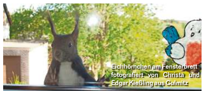
Eichhörnchen am Fensterbrett