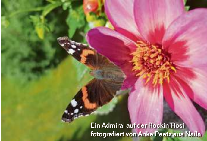
Ein Admiral auf der Rockin'Rosi