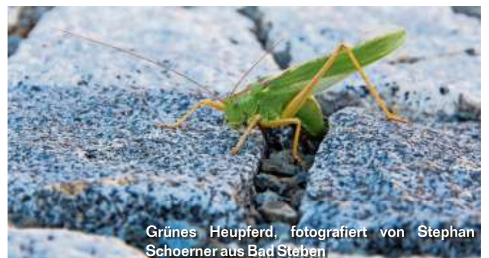
Grünes Heupferd, fotografiert von Stephan Schoerner aus Bad Steben