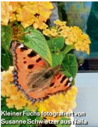
Kleiner Fuchs