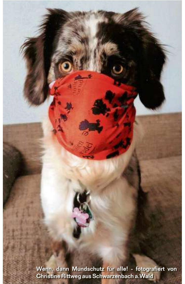
Wenn, dann Mundschutz für alle!