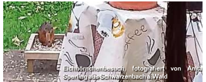
Eichhörnchenbesuch, fotografiert von Anita Sperling aus Schwarzenbach a. Wald