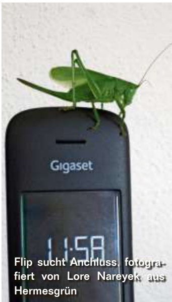
Flip sucht Anschluss