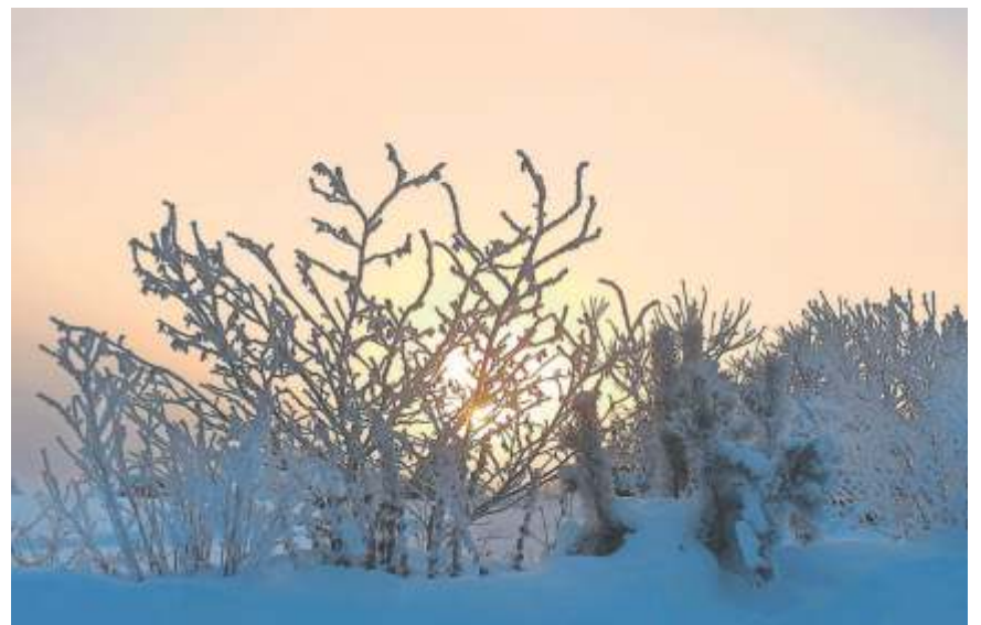
Den Sonnenaufgang mit oder im Saharastaub der vergangenen Woche hat WIR-Leser Erich Schaller aus dem Berger Ortsteil Gottsmannsgrün fotografiert.