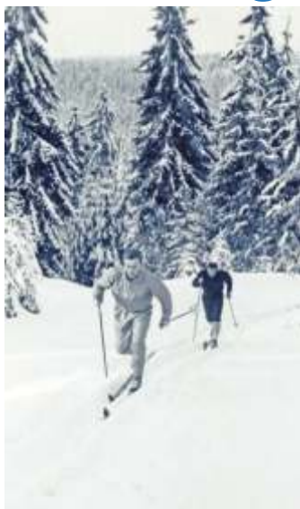
Früher wurde beim Langlauf mit Skiern gespur

Und weil es früher so viel Schnee gab, war der Start am