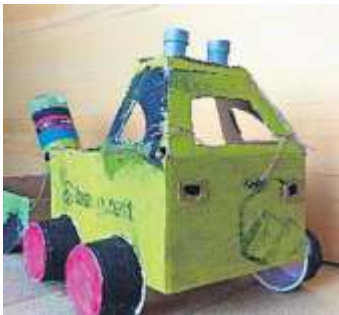
1. Preis: Mondfahrzeug