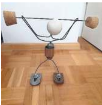
2. Preis: Gewichtheber