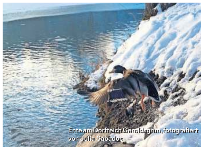
Ente am Dorfteich Geroldgrün