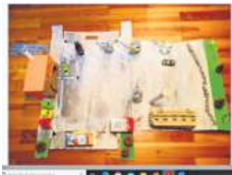
2. Preis: Wertstoffhof