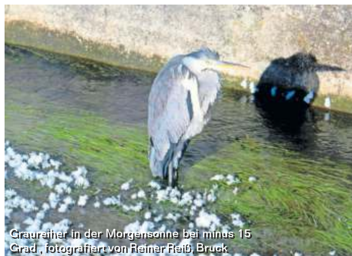
Craureiher in der Morgensonne bei minus 15 Grad