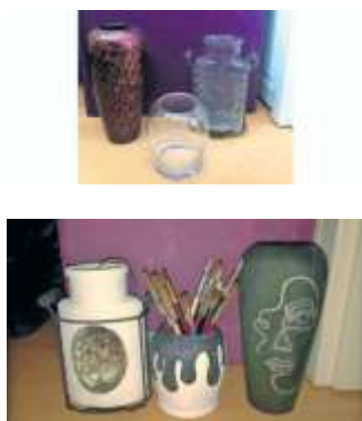
3. Preis: Von alt zu neu