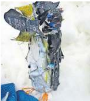
1. Preis: Pinuginfreunde