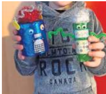
3. Preis: Dosen