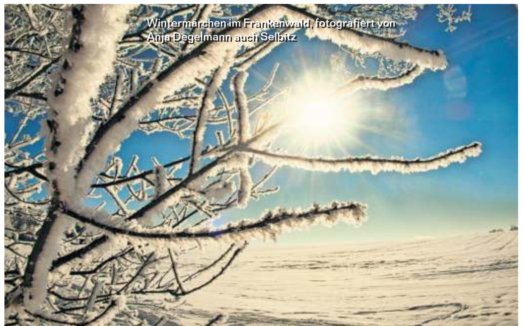
Wintermärchen im Frankenwald