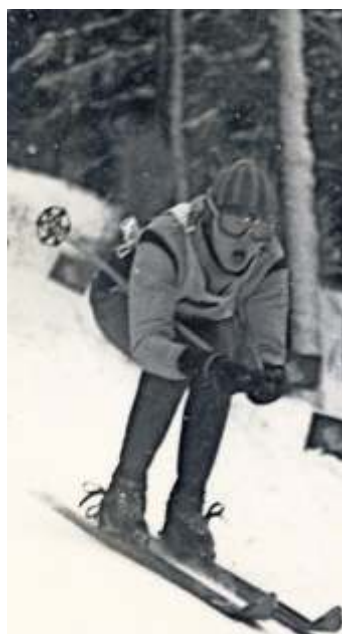
Mehr Platz für die Wettkämpfer nach dem Ausbau der Abfahrtsstrecke

Die Rodungen begannen im Jahre 1963. Ein Fernsehteam aus Nürnberg überzeugte sich von den