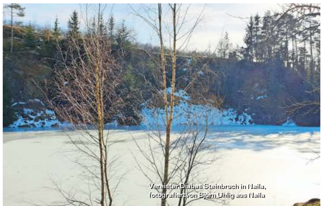
Vereister Diabas Steinbruch in Naila