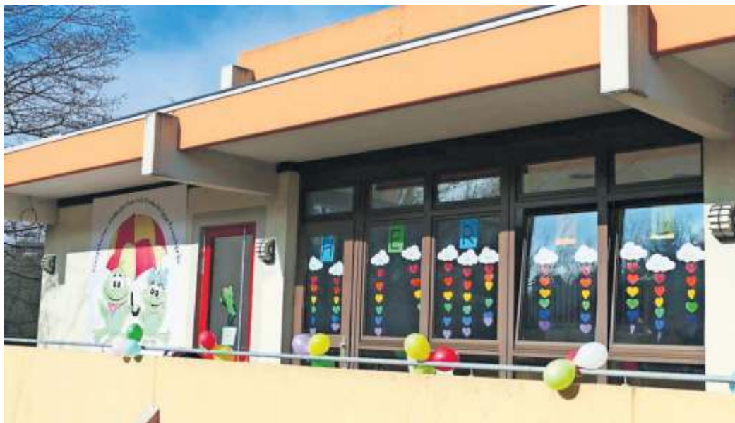
Der Blick von außen auf das neue Haus Naale mit dem neuen Logo.

in Anspruch genommen habe bis man ein nachhaltiges Ergebnis präsentieren konnte. Er dankte für die vielfältige Unterstützung seitens der Fachbehörden des