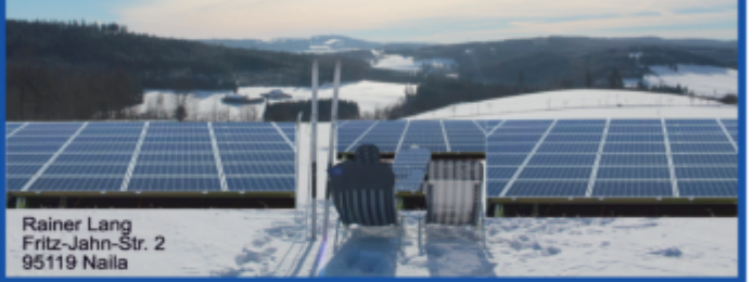
Rainer Lang Fritz-Jahn-Str. 2 95119 Naila