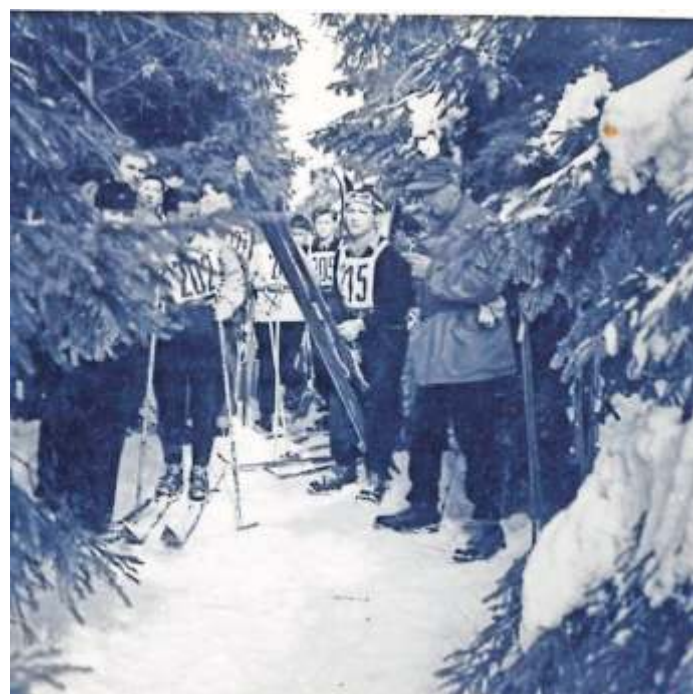
So schmal war die Abfahrtsstrecke vor dem Ausbau

Arbeiten und brachte eine Reportage in der Münchner Abendschau. Die Einweihung der neuen Abfahrtsstrecke erfolgte am 19. Januar 1964 mit der Austragung der alpinen Gaumeisterschaften. Es folgten viele Wettkämpfe. So starteten am 3. Januar 1982 etwa 150 Teilnehmer zum Abfahrtslauf. Unter ihnen befand sich auch vom deutschen DSV-Kader Franz Ferstl, ein Bruder von dem ehemaligen deutschen Spitzenläufer Sepp Ferstl, der als Tagessieger einen neuen Streckenrekord aufstellte. Inzwischen wurde an der Bergwiese ein Doppelschlepplift gebaut. Diese wurde zu den Weihnachtsfeiertagen 1970 eröffnet. Eine Fahrt an der Bergwiese kostet für Kinder 40 Pfennige, für Erwachsene 50 Pfennige. Einige Jahre später kam der Kleinskilift dazu. Er dient den Kindern und den Skischulen.