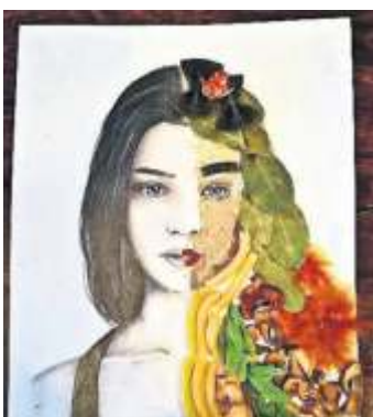
1. Preis: Herauskommen