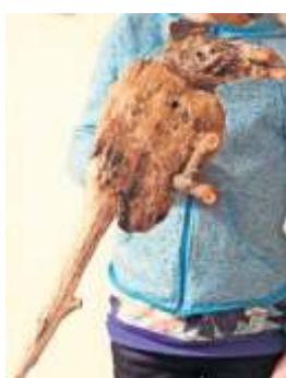
3. Preis: Spaziervogel