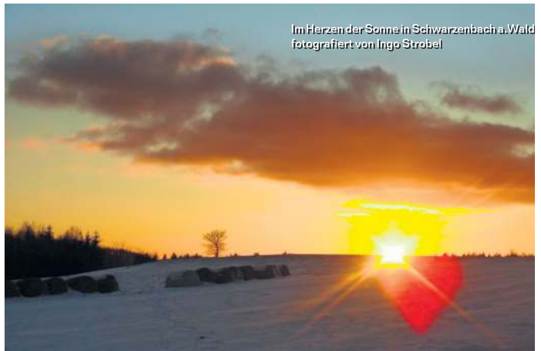
Im Herzen der Sonne in Schwarzenbach a. Wald