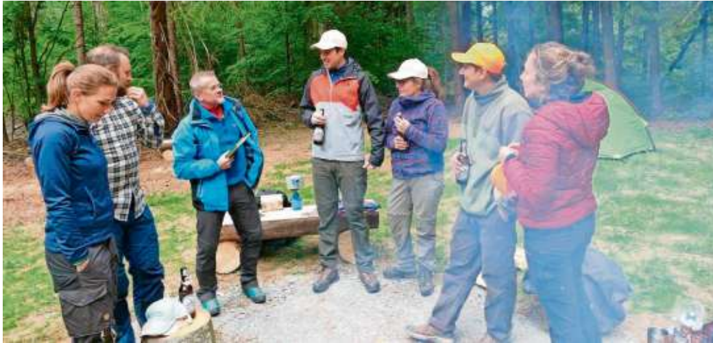
Die ersten Trekker am neu eröffneten Trekking-Platz „Rehwiese“, die aus dem Schwarzwald und aus der Nähe von Stuttgart angereist waren. Zum Einstand gab es allerlei Geschenke.

Die jungen Leute auf der Rehwiese sind begeistert von dem „gebotenen Komfort“ und auch der einfachen und pragmatischen Buchung. „Alles hat super geklappt.“ Sie regen an, eine Mülltonne aufzustellen und die Toilette mit einem Zahlenschloss zu versehen, so dass sie von Trekkern benutzt werden kann, die den Code bei der Buchung erhalten sollten. Bürger-