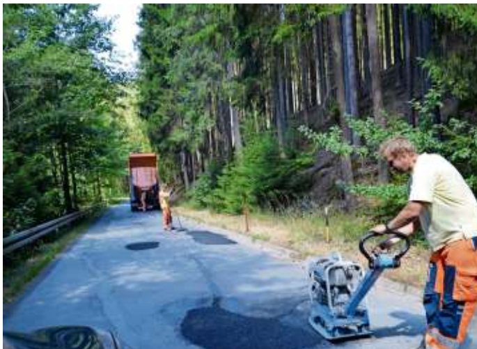
Die bisherigen Ausbesserungsarbeiten an der GV Sorg-Thiemitz.

Straßenausbau und -sanierung anstatt immer wiederkehrende Einzelausbesserungen. Mit dem Thema Straßenunterhalt setzte sich der Stadtrat auseinander. Bei einer Besichtigung vor Ort wurde festgestellt, dass bei der Verbindungsstraße Sorg-Thiemitz es nicht ausreichte, die Asphaltdecke zu erneuern. Daraufhin, hat die Verwaltung die grundsätzliche Förderfähigkeit der beiden Gemeindeverbindungsstraßen Sorg sowie Döbra-Rodeck mit der Regierung von Oberfranken geklärt. Beide der jeweils rd. 1,7 Kilometer langen Straßen könnten als Vollausbau erneuert werden. Beide Fraktionen wollen die Stadt zukunftssicher aufstellen