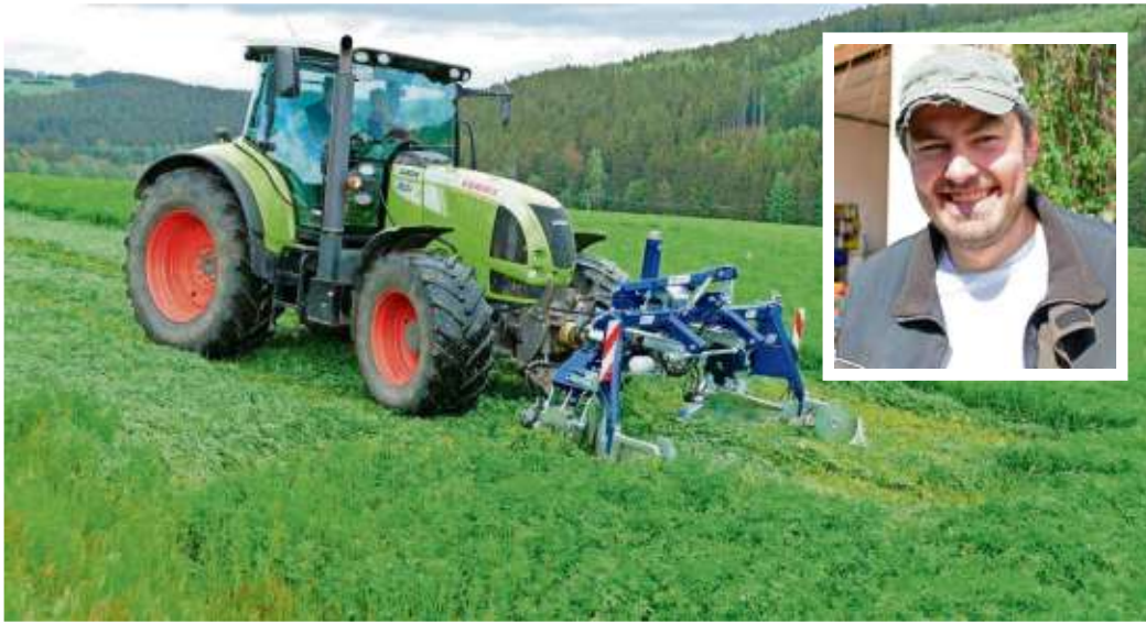
Das Doppelmessermähwerk sieht aus wie beim herkömmlichen Balkenmäher, nur um einiges in der Schnittbreite größer und somit ganze 8,80 Meter in einem Mähvorgang.