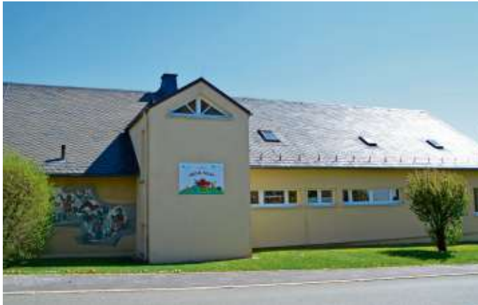
Der bisherige Kindergarten genügt nicht mehr den Anforderungen.

Der Kirchenvorstand der Evang.-Luth. Kirchengemeinde und der Stadtrat favorisieren den Neubau mit der Stadt als Bauherrn. Die Trägerschaft bleibt bei der Kirchengemeinde. Ein Neubau statt Sanierung und Umbau ist erforderlich, weil die heutigen zusätzlichen Raumbedürfnisse für zum Beispiel Schlaf-, Elternwarte- und Speiseraum sowie die Einrichtung einer fünften Gruppe auf dem Grundstück wirtschaftlich nicht umgesetzt werden können.