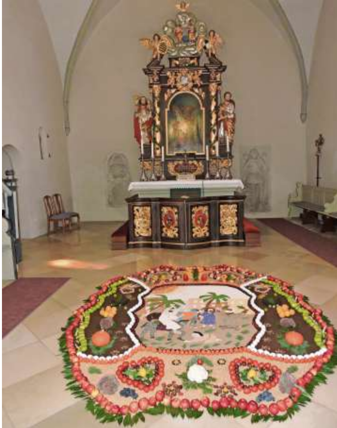
Das Foto zeigt den Erntedankfrüchteteppich vom vergangenen Jahr.