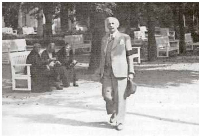
Henri Marteau einige Wochen vor seinem Tod 1934 im Kurpark in Bad Steben.

Marteaus außergewöhnliches Talent war schon früh erkennbar. Als Fünfjähriger erhielt der gebürtige Franzose mit deutscher Mutter ersten Unterricht, als Zehnjähriger debütierte er in seiner Heimatstadt Reims vor 2.000 Zuhörern und wurde frenetisch gefeiert. Seine glanzvolle Karriere führte ihn nach Genf, wo er mit nur 26 Jahren Professor am Conservatoire de Musique wurde. Höhepunkt seiner musikalischen und pädagogischen Laufbahn war schließlich die Berufung zum Violinprofessor an der Hochschule für Musik in Berlin im Jahr 1908. Künstlerfreundschaften verbanden ihn unter anderem mit Max Reger, Peter Tschaikowsky und Antonín Dvorak. Über 50 Jahre füllte Marteau mit seinem meisterhaften Violinspiel Konzertsäle auf der ganzen Welt – in Europa, Nordamerika und im Nahen Osten gab der Violinvirtuose mehr als 3.000 Konzerte. 1911 kam Marteau auf Einladung seines Freundes Georg