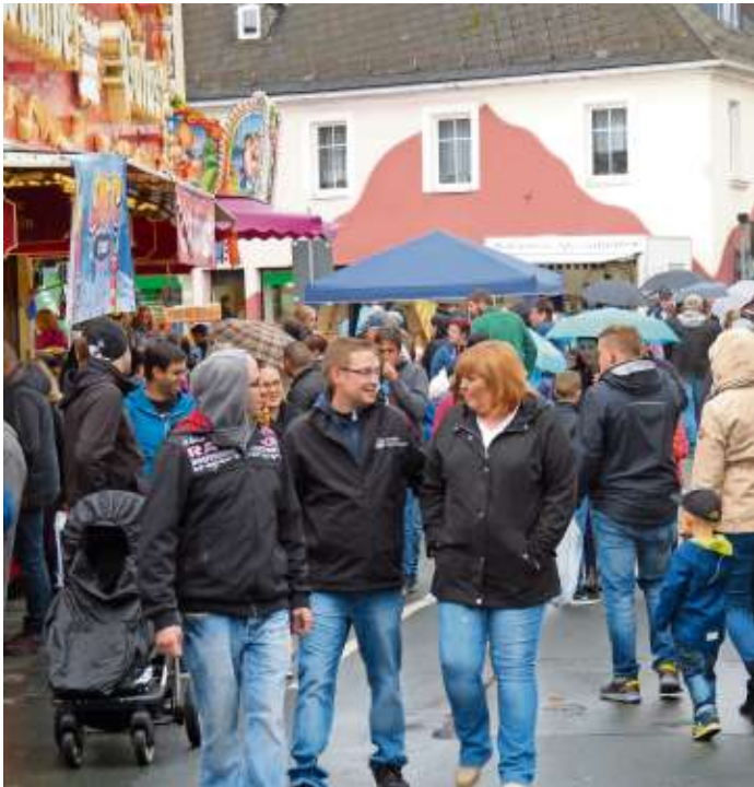
Entspannter Bummel durch die Innenstadt: beim Nailaer Herbst ist für jeden etwas dabei.