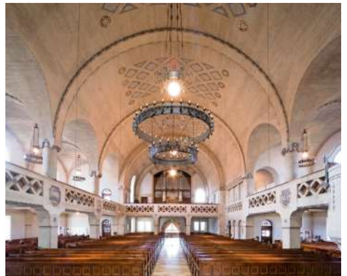
Freunde des Jugendstils finden auch im fotogenen Innenraum der Lutherkirche interessante Motive.

viel über Licht, Perspektiven, Bildkomposition und Fototechnik. Um genügend Zeit für die Bedürfnisse und Fragen des Einzelnen zu haben, ist die Teilnehmerzahl bei den Touren begrenzt. Als Fotoausrüstung empfiehlt sich eine digitale Spiegelreflex- oder spiegellose Kamera, Stativ und Fern-/Kabelauslöser sind ratsam, alle Objektive sind geeignet. Grundkenntnisse der Fotografie und Vertrautheit mit der eigenen Ka-