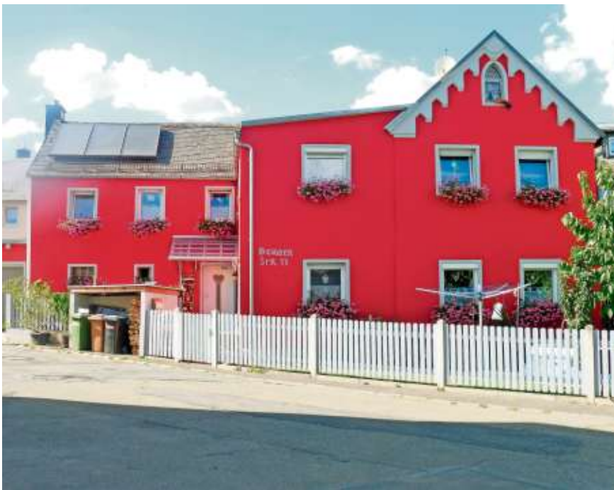
Fam. Reuschel aus Bruck, Sieger im Jahr 2018 beim Fassadenwettbewerb.

Der Anmeldeschluss für beide Wettbewerbe ist der 30. Oktober 2019 .