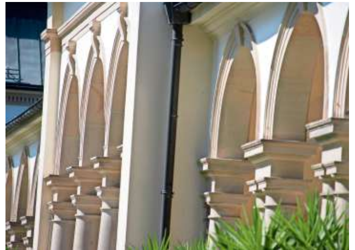
Die Architektur des Jugendstils steht im Fokus des Foto-Workshops im Bad Stebener Kurpark.