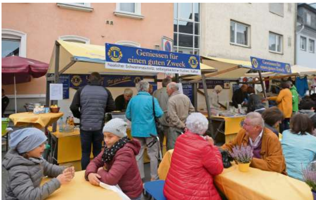
Genießen für den guten Zweck heißt es beim Hilfswerk des Lions Club Naila-Frankenwald.

der in der Region, finanzieren das "gesunde Schulfrühstück" an der Nailaer Grundschule und Projekte der Jugendarbeit und Seminare wie Lions Quest oder Kindergärten plus, sind in der Gesundheits- und Drogenprävention aktiv, helfen bei Naturkatastrophen, bei der Nailaer Tafel und spenden für Projekte, die der Allgemeinheit zugute kommen. Eine für alle sichtbare Spende ist der „offene Bücherschrank“ auf dem Marktplatz in Naila, mit einer Lesebank davor, aus dem sich jedermann, jederzeit unentgeltlich Lesestoff holen kann.