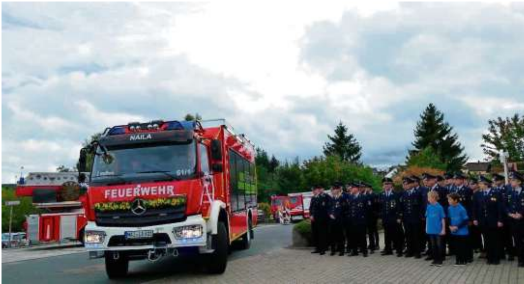
Die Freiwillige Feuerwehr Naila präsentiert im Rahmen des Nailaer Herbsts ihren neuen Rüstwagen.