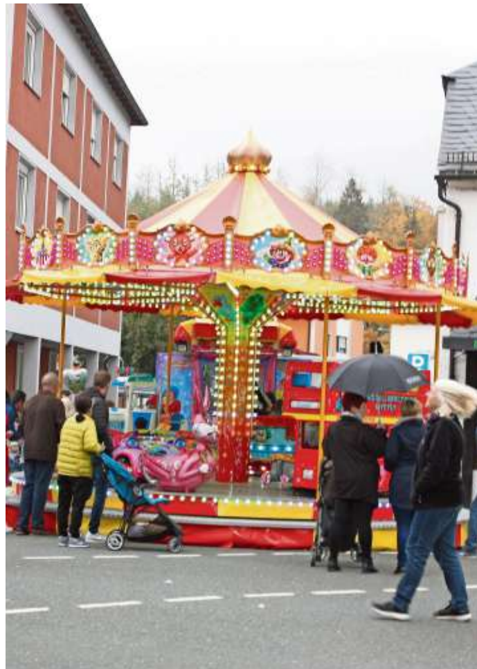
Neben vielen Marktständen ist auch für die kleinsten Besucher einiges geboten.