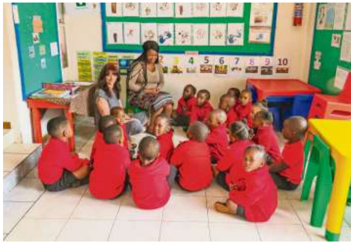
Die Kinder bekommen in der Vorschule „Wings of Hope“ alles, was ein Kind für die vorschulische Entwicklung und Bildung benötigt.