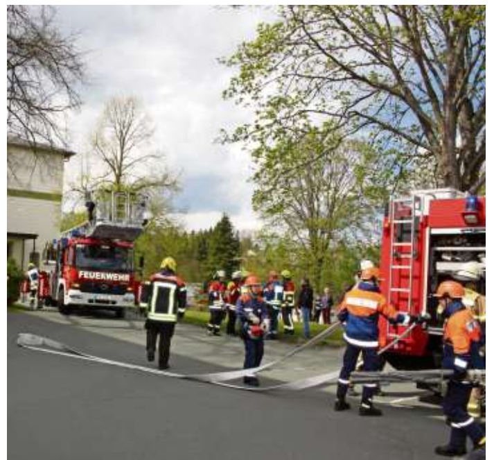
Großübung zum Berufsfeuerwehrtag der Jugend an der Evangelischen Schule in Naila mit 120 jugendlichen Feuerwehr-Einsatzkräften und den Einsatzfahrzeugen der beteiligten Wehren, unter der Einsatzleitung von Bastin Häßler.

Naila - Seit 20 Jahren wird in der Region ein Berufsfeuerwehrtag veranstaltet. Dieser dient dazu, dass junge Feuerwehrmänner und Frauen den Alltag einer Berufsfeuerwehr kennenlernen. Daneben soll aber auch die Kameradschaft der Jugendlichen im Alter von 12 bis 18 Jahren gepflegt und die Zusammenarbeit geprobt werden, um für einen