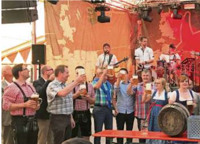
O'zapft ist - heißt auch heuer wieder beim 154. Heimat- und Wiesenfest

Eine Besonderheit ist außerdem, dass die Flaschen sogar mit dem Wiesenfestmotiv versehen sind und ein besonders individuelles Schmuckstück darstellen. Die Verkaufsfahrt führt wieder durch alle Ortsteile und