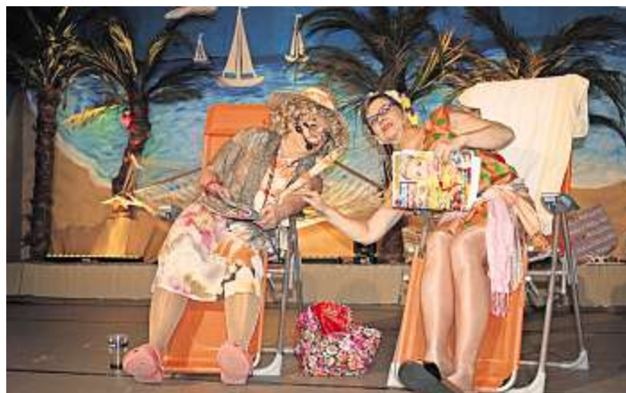
Nur 118 Plätze gab es in der TuS-Airline 08/15 - deshalb flogen einige Narren mit dem Heißluftballon nach Malle.